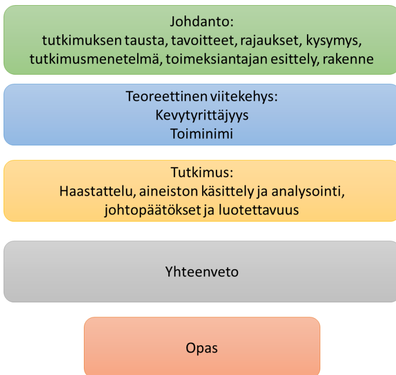
Kuvio 1. Opinnäytetyön rakenne

Opinnäytetyön johdanto paljastaa perusteet ja lähtötiedot aiheen tutkimiselle, perustele aiheen valinnan, määrittelee tavoitteen, pääkysymyksen, tutkimusmenetelmät, hankitun tiedon lähteistä. Lisäksi johdanto sisältää kuvioineen rakenne osion.