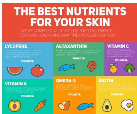
Kuva 11. Esimerkki 2. (Chibana 2016)

Yllä näkyvän infograafin ideana on kertoa lukijalle eri ruokien sisältämistä ravintoaineista. Tekstien asettelu on sekavaa ja lukijalle jää epäselväksi, mitä ravintoaineita kustakin ruokalajikkeesta loppuen lopuksi löytyy. Informaation määrä on vähäinen ja herättää lukijassa lähinnä vain kysymyksiä. Kuvat antavat infograafille kulahtaneen ilmeen, eikä lopputulos ole visuaalisesti houkutteleva, vaan ennemminkin väsynyt esitys tärkeästä aiheesta. (Chibana 2016.)