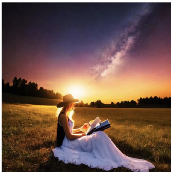
How many books is she reading? ... our writer's AI image.

Kuva 7. Kuvakaappaus artikkelista, jossa näkyy esimerkki tekoälyn digitaalisesti luomasta kuvituksesta. (Shaff 2023)