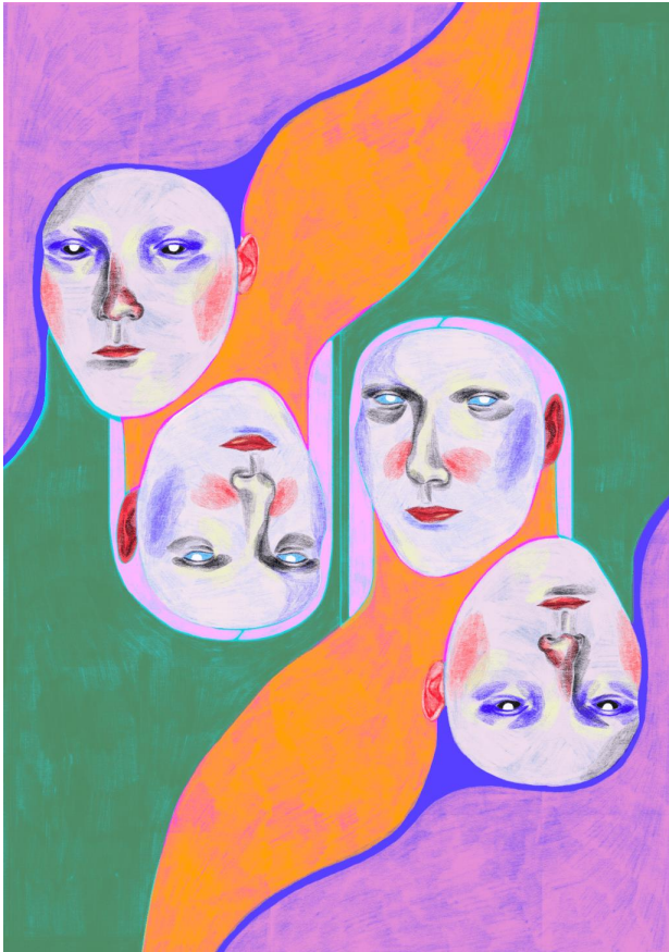
Kuva 5. Carla Petelskin taideteos nimeltä Parallel. (Petelski 2022)

Pakkausten etiketeissä nähtävät kuvitukset ovat nykyään suurimmaksi osaksi tehty tietokoneiden piirto-ohjelmilla. Yleisin näky elintarvikepakkausten kyljissä lienee voimakkaasti käsitellyt valokuvat esimerkiksi appelsiinista, jota on elävöitetty lisäämällä siihen väriä tai appelsiinimehun pisaroita kuvankäsittelyohjelman avulla. Myöskin digitaalisesti toteutettuja piirroksia esiintyy paljon ja onkin hyvin tuotekohtaista, milloin valokuvalla ja milloin piirroksella varustettu etiketti on parempi vaihtoehto. Useimmissa tuotepakkauksissa kuvitusta ei kuitenkaan nähdä lainkaan, vaan graafinen puoli ja houkuttelevuus on saatu tuotteen pakkauksen väreillä ja nimessä näkyvällä fontilla aikaan. Myös abstraktimaa kuviointia näkee ajoittain. Seuraavassa kuvassa (kuva 6.) esimerkki saippuapakkauksen digitaalisesti toteutetusta etiketistä.