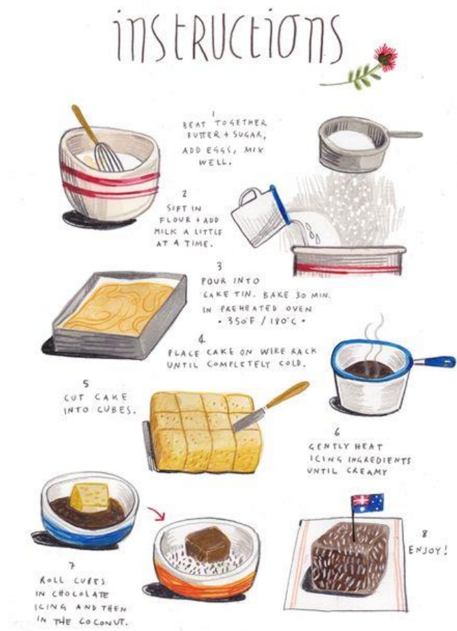
Kuva 9. Havainnekuva Felicita Salan kuvittamasta reseptistä (Sala 2013)

Informaatiota sisältävän kuvan tarkoituksia on havainnollistaa rakennetta ja tapahtumien kulkua sekä osoittaa syy-seuraussuhteita. Se toimii pääosin ymmärtämisen ja oppimisen välineenä ja täten onkin hyvin yleinen näky esimerkiksi oppikirjojen sivuilla. Infografiikkaa ei käytetä huvikseen sivujen täyteenä, vaan kuva on aina jollain tavalla tarpeellinen ja tekstiä tukeva. Tarpeettomilla kuvilla on siinä mielessä huono vaikutus, että se voi johtaa lukijan harhapoluille. (Niemelä 2003, 55). Infografiikka toimii tekstin ehdoilla, ei toisinpäin. Vaikka infografiikoissa kuvitus on lähtökohtaisesti tekstille alisteinen, on kuvituksen rooli tekstin rinnalla siitä huolimatta hyvin tärkeä. Kuvallinen ilmaisu auttaa tekstiä tehokkaammin kuvaamaan konkreettisia asioita kuten värejä, muotoja ja sijaintia. Visuaaliset elementit herättävät huomion paremmin kuin pelkkä teksti ja sitä myöten myös pitävät lukijan mielenkiinnon otteessaan. (Hatva 2018, 101.)