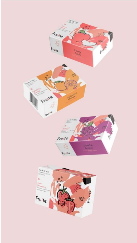
Kuva 6. Digitaalisesti kuvitettu saippuapaketti. (Fruite- Packaging Design Concept 2019)