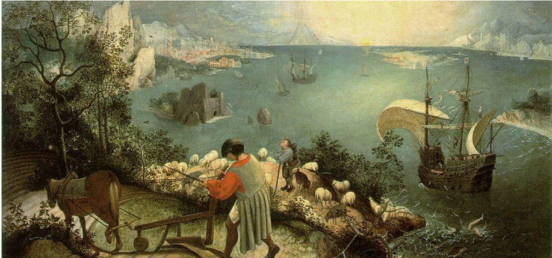
Kuva 2. Pieter Bruegelin maalaus Ikaroksen putoaminen. (Bruegel 1550-luku)