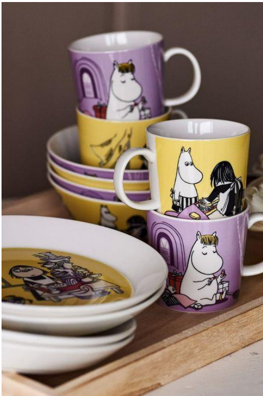
Kuva 1. Arabian astiastoa Tove Janssonin muumikuviinnilla (Nordicnest)

digitaalisesti toteutettava grafiikka ja kuvitus yksinkertaisesti säästävät työntekijöiden aikaa ja vaivaa. Ympärielle katsoessa maalauksia ja piirroksia näkee kuitenkin edelleen monessa eri muodossa, erityisesti tunnetuilta taiteilijoilta kuten vaikkapa Tove Janssonilta. Janssonin muumihahmojen pohjalta kuvittaja ja graafinen suunnittelija Tove Slotte on suunnitellut suurimman osan Arabian muumiastiastoista ja yksi hänen töistään näkyy alla olevassa kuvassa (kuva 1). (Koste 2019, hakupäivä 14.5.2023).