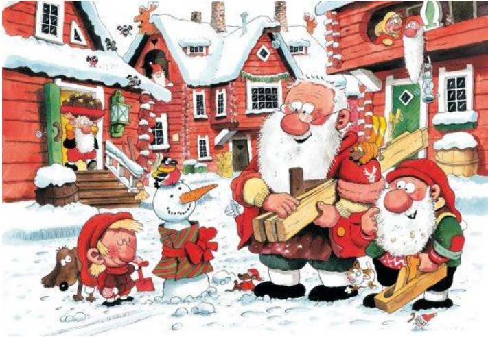
Kuva 3. Mauri Kunnaksen vesiväritekniikalla toteutettu lastenkirjan kuvitus kirjasta ”12 lahjaa joulupukille” (Kunnas 1987)