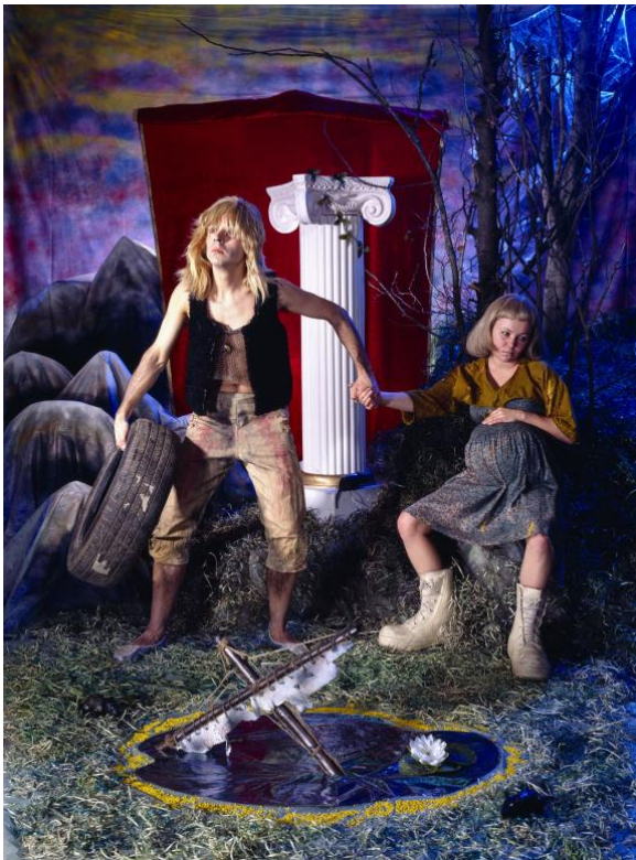
Kuva 4. Lavastettu fantasiakuva. Kyseessä Magnus Scharmanoffin teos nimeltä Resignation. (Scharmanoff, 1995)