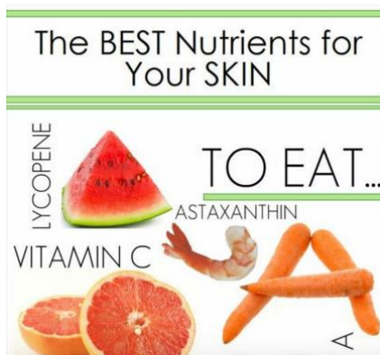
Kuva 10. Esimerkki 1. (Chibana 2016)

Seuraavassa kuvasarjassa (kuva 10. ja kuva 11.) on esitelty kaksi infograafia samasta aiheesta: Ensimmäinen on heikosti toteutettu infograafi ja toinen paranneltu versio.