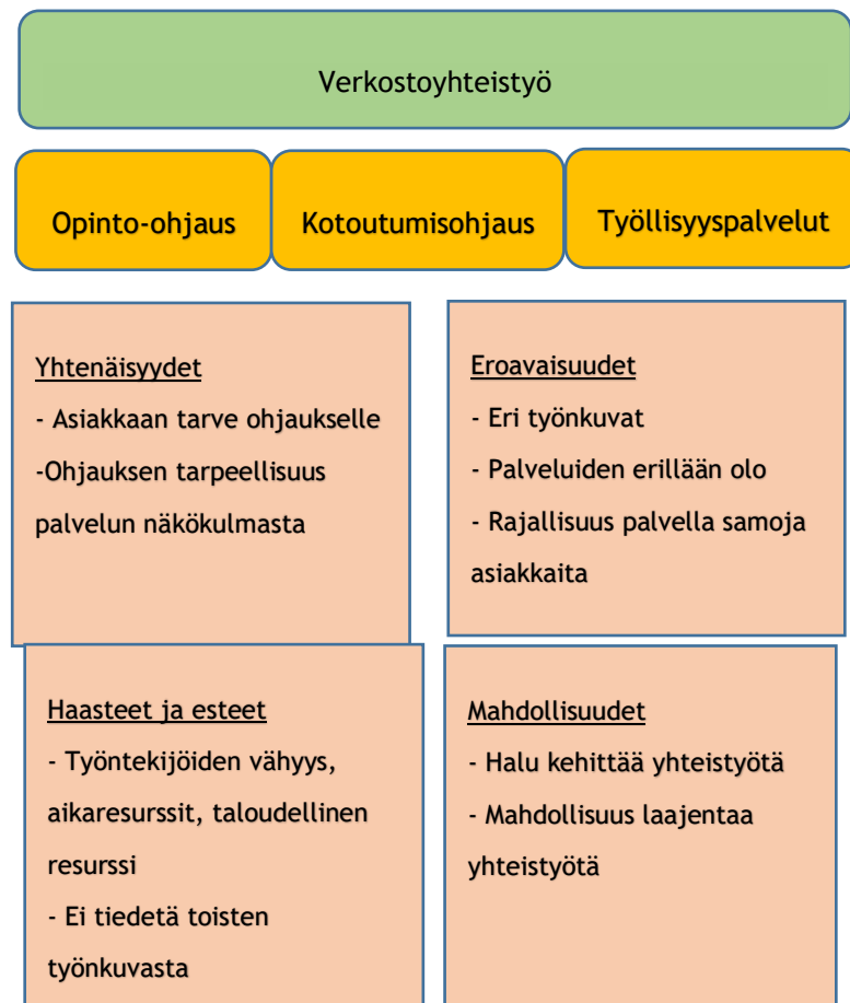
Kuvio 3: Ylä- ja alaluokat

opinnäytetyössämme keskiössä, mutta asiakkaan ohjauksen kannalta sekä maahanmuuttajien neuvontapalveluilla että työllisyyspalveluilla on iso rooli ja aikuisten perusopetuksesta ohjautuu henkilöitä heidän palveluihinsa.