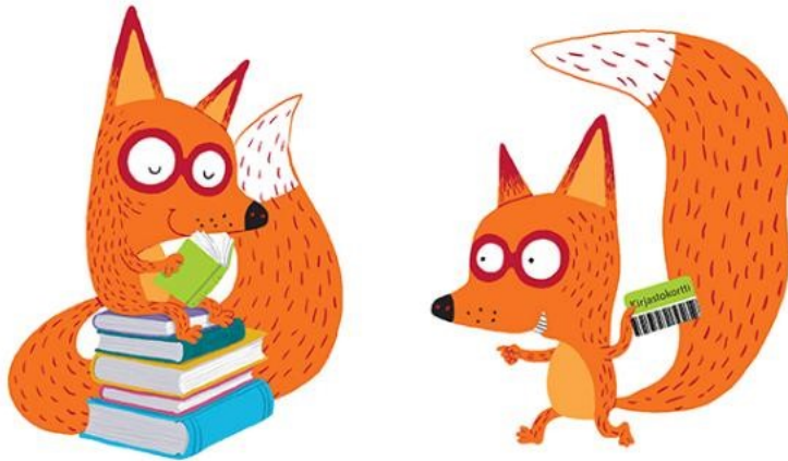
KUVA 3. Kuvassa on Kirjastokettu, joka on Outi-kirjastojen maskotti.

Kirjastomestari tutkimusretkellä on kolmannen ja neljännen vuoden oppilaiden oppimiskokonaisuus. Kirjastomestari osaa etsiä tietoa ja tietää mitä eroa on kaunokirjallisuudella ja tietokirjallisuudella. Tutkimusretkellä tutustutaan myös kirjaston lukitusjärjestelmään. Kolmasluokkalaisille järjestetään myös kirjavinkkaus. (Oulun kaupunki 2021d, Oulun kaupunki 2021f.)