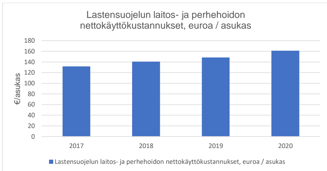
Taulukko 1 Lastensuojelun laitos- ja perhehoidon nettokäyttökustannukset, koko Suomi (Sotekuva 2023).

Sotekuva-sivuston indikaattorista (taulukko 1) voimme päätellä, että kustannukset lastensuojelun laitos- ja perhehoidon osalta ovat nousseet joka vuosi, vuosien 2017–2020 aikana. Vuodesta 2017 vuoteen 2020 kustannukset ovat nousseet keskimäärin noin 7 % vuosittain. Keskimäärin koko Suomessa kustannukset ovat olleet 2020 vuonna 161,1 euroa asukasta kohti. Ero suurimman (Vantaa ja Kerava 239,9 euroa) ja pienimmän (Pohjanmaa 96 euroa) välillä on noin 2,5-kertainen. Kustannukset eivät jakaannu tasaisesti Suomen hyvinvointialueiden välillä. Lastensuojelun laitoksien ja perhehoidon luokkaan kuuluvat lastensuojelun laitokset, muu lasten laitoshoido, perhekodit, sijaisperhehoito ja näiden palvelujen tuottajien asiakaspalveluostot. Sivustolta ei käy ilmi, mistä erot ja kustannusten nousu johtuvat. (Sotekuva 2023.)