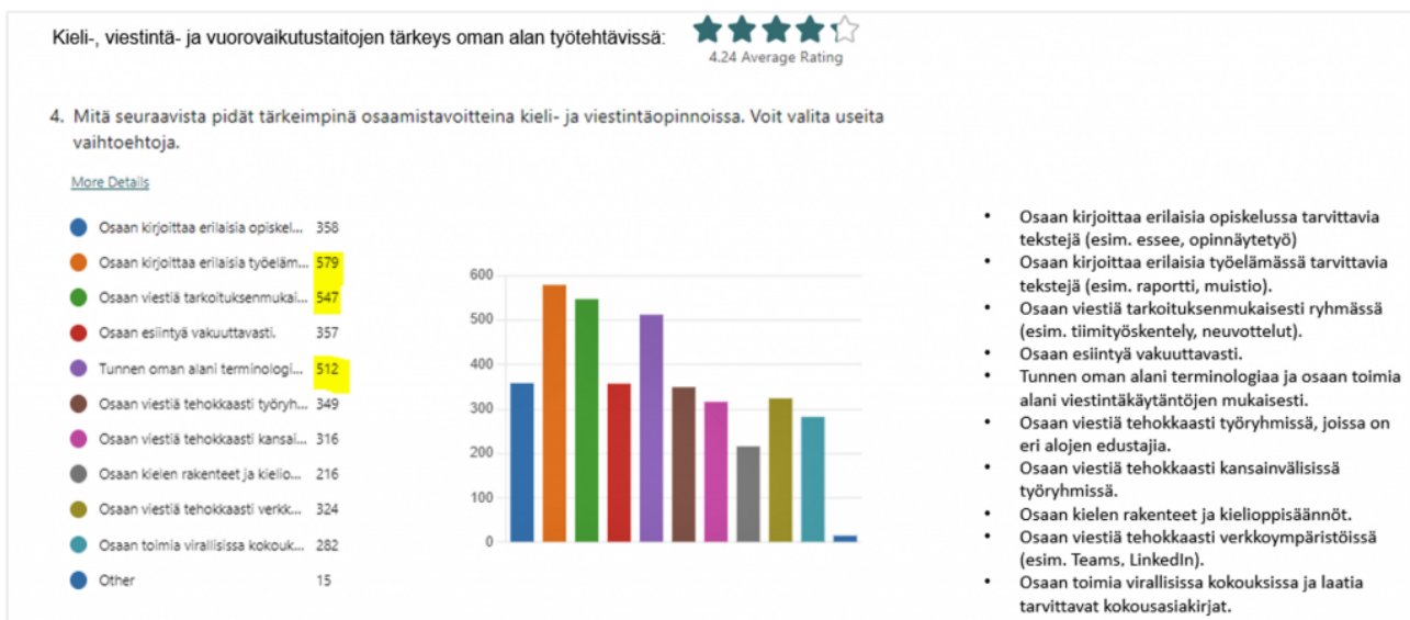
KUVIO 2. Tärkeimmät osaamistavoitteet OPS-kyselyn mukaan. Kuvio avautuu isommaksi klikkaamalla.

Vastaajat pitivät kieli- ja viestintäopintoja tärkeinä. Tärkeimmiksi osaamistavoitteiksi nousivat tiedot ja taidot, jotka liittyvät omaan opiskeluun sekä tulevaan työelämään: oman alan tekstien kirjoittaminen, toimiminen alan viestintäkäytäntöjen mukaisesti, oman alan terminologian hallinta sekä ryhmäviestintätaidot. (Kuvio 2.)