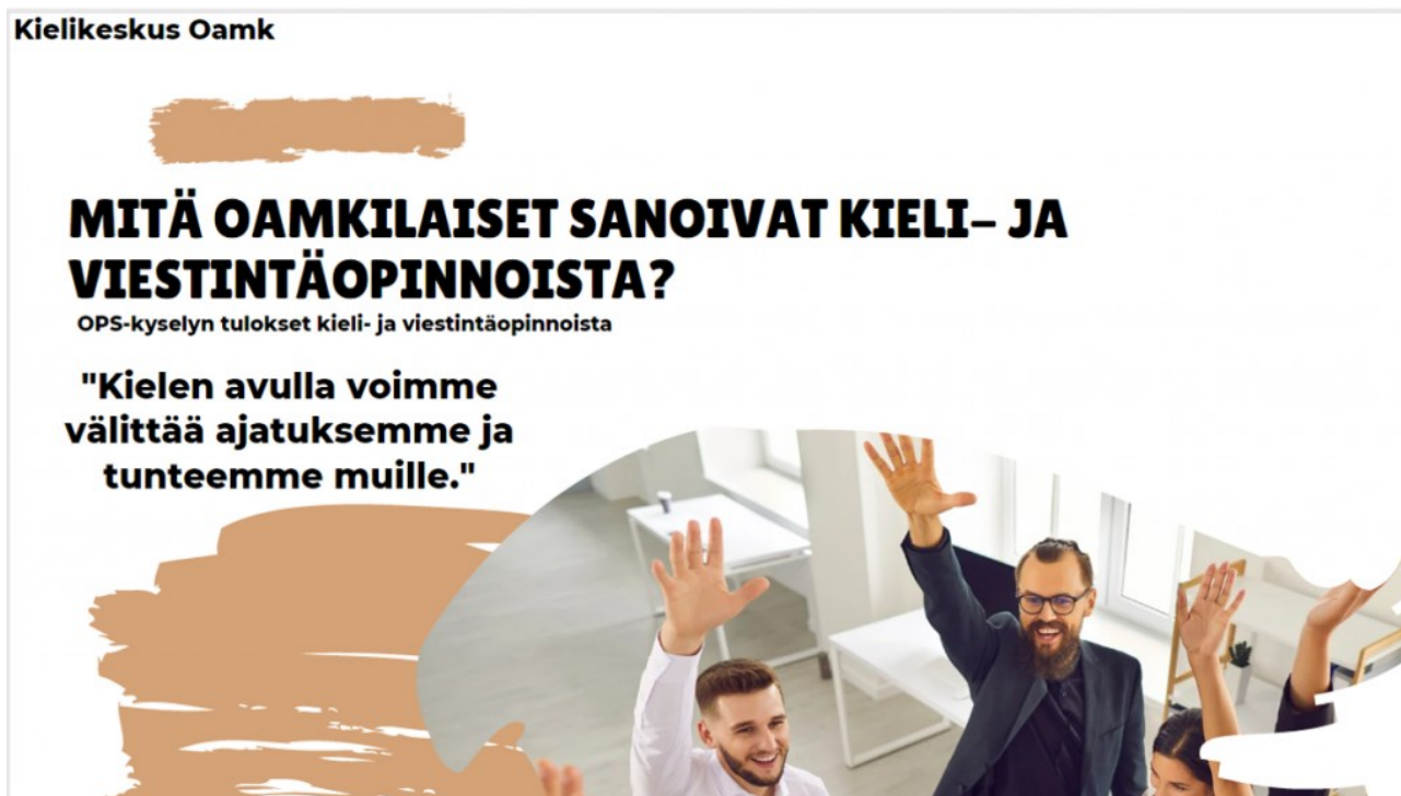
KUVA 1. Kooste OPS-kyselyn tuloksista.

Sanalliset palautteet koottiin yksiköittäin jaettaviksi Kielikeskuksen vastuulehtoreille, jotka saattoivat hyödyntää niitä vastuualojensa yksikköpalaverissa. Lisäksi palautteista tehtiin raportti, joka käsiteltiin Kielikeskuksen yksikköpalaverissa. Opiskelijoille ja henkilöstölle koottiin tuloksista esitys, joka on nähtävissä opinto-oppaan Kieliopinnot-sivulla . (Kuva 1.)