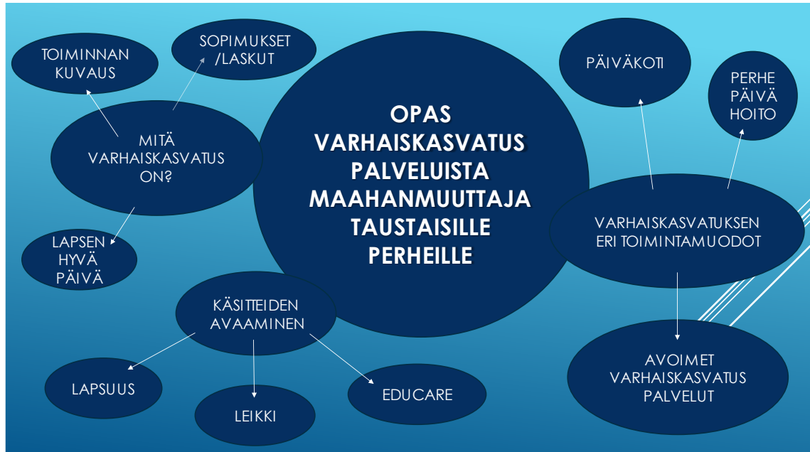
Kuvio 2. Aivoriihi-menetelmällä kerätty aineisto oppaan sisällöistä.