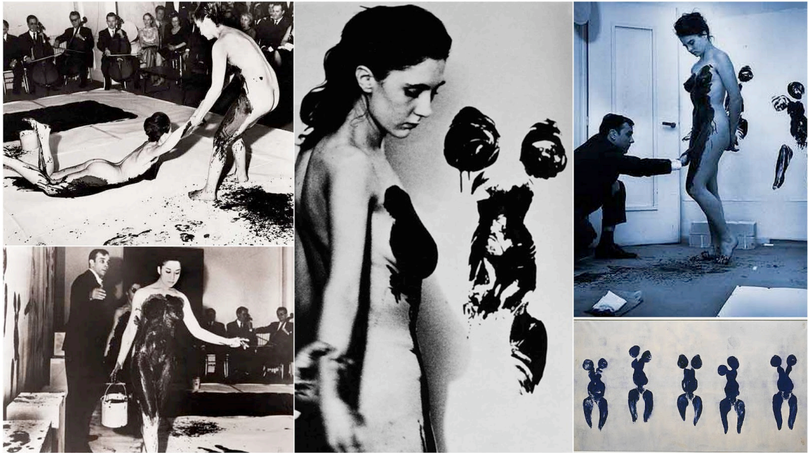
Kuva 1. Yves Klein Anthropometries

Tämä teos synnytti ajatuskerän liittyen alastomuuteen, performanssitaiteeseen, ihmiskehoon, taiteiden risteämiskohtaan ja poikkitaiteellisuuteen. Minulle alastomuus nousi todella merkittäväksi osaksi tuota performanssia. Tajusin, että olen alitajuisesti miettinyt pitkän aikaa teemoja, jotka koskevat alastomuutta, katseen alaisuudessa olemista, esilläolemista, alastonmallina työskentelemistä ja kuvataiteen objektina toimimista, klassista naisvartaloa, länsimaista kehonkuvaa, suomalaista saunakulttuuria, yhteisaunomista, pornografiaa, vääristynyttä kehosuhtautumista, kehoa objektina, syömis-häiriöitä ja median synnyttämää kuvaa oikeasta kehosta, mikä on ”oikein”, yhteiskuntakelpoista ja sitä, miksi alastomuus on niin iso tabu.