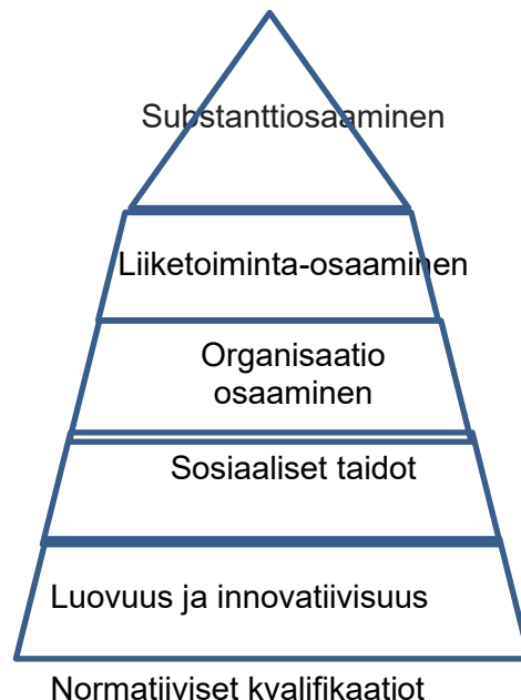
Kuvio. 2 yksilöosaamiset (Viitala 2007, 116)

Seuraavassa kuviossa (kuvio 2) on valmiuksia, jolla voidaan ajatella ammattitaitoa ja jolla yksilö menestyy tehtävissään. Garavan McGuire (2001) Vertaavat ammattitaitoa jäävuorenhuippuun, jossa yksilön tiedot ja taidot ovat näkyvissä huipulla, mutta alaosa koostuu kehitystä säätelevistä tekijöistä, jotka eivät välttämättä näy päällepäin.