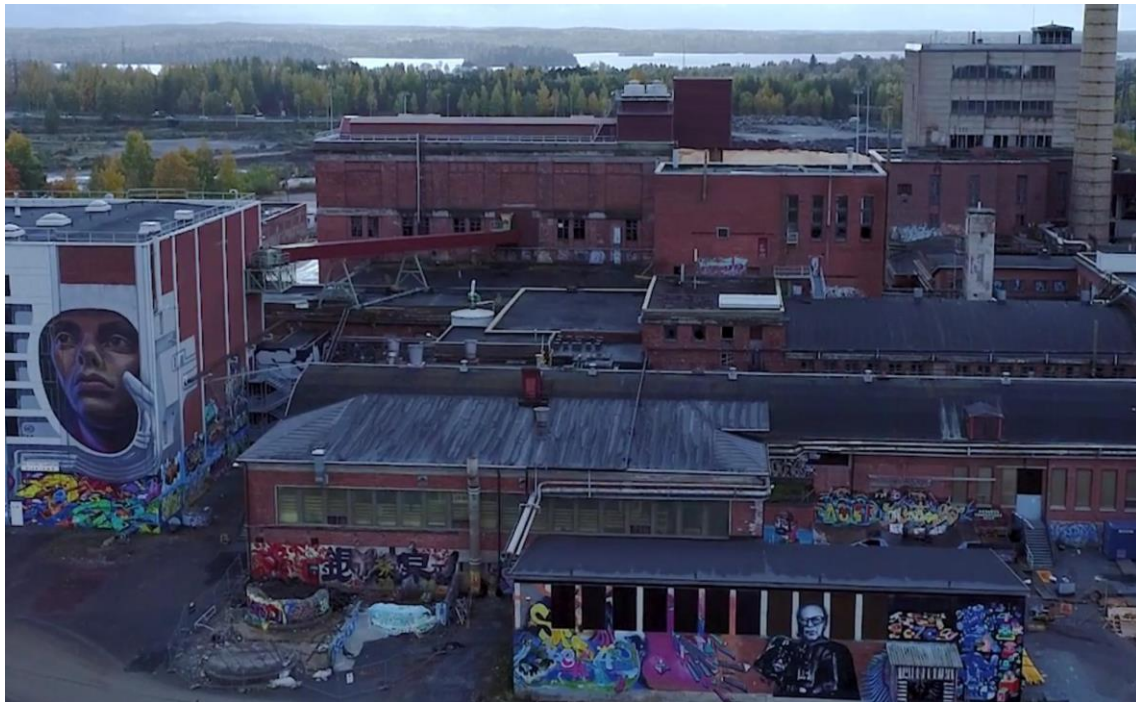
Kuva 5. Hiedanranta yleiskuva pohjoisesta etelään katsoen.

2017–2018 teimme yhteistyötä Meeting of Styles tapahtuman kanssa (Aamulehti 27.7.2017, 25.4.2018) (kuva 5). Näinä vuosina alueella kävi maalaaajia arviolta reilusta 20 maasta ja yhteensä 4 maanosasta. Vuodesta 2019 vuoteen 2021 tapahtuma oli taas pienempi ja paikallisempi. Kirjoitushetkellä alueella on nyt reilun 3 500 neliömetrin alalla seinämaalauksia ja se on Suomen ja pohjoismaiden mittapuulla verrattain laaja ja omaleimainen maalauskeskittymä. Siellä on oman arvion mukaan vuosittain noin 7 000–15 000 kävijää. Paikasta on muodostunut uudenlainen elävä nykymaalauksen ulkoilmamuseo.