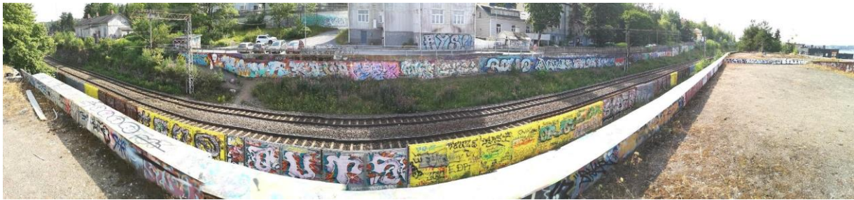
Kuva 4. Pispalan feimi, Näkymä huopakattotehtaan katolta ratakadulle. Matti L, 2021

Pispalan feimi tai kuten väitöskirjatutkija Kai Ylinen siihen viittaa “Santalahti” (Ylinen 2018) on toiminut eräänlaisena sattumanvaraiseen tyyliin toimivana kulttuuri “hubina” Tampereella. Henkilökohtaisen näkemyksen mukaan tämän, ja monen muun alakulttuurikehdon jälkikasvuna on sittemmin syntynyt Hiedanrannan kulttuurialue yhteistyönä monien eri toimijoiden kanssa. Santalahti, Pispalan fame, Lielahden fame ja Hatanpään fame ovat olleet Tampereen tyylimaalauskeuhon lähihistoriassa isossa osassa. Uskon että maalaukset, skeittaus, keikat ja moni muu niissä kehittynyt toiminta on ollut tärkeää “Suomen suosituimman kaupungin” synnyssä (STT 2022), ainakin paperilla maailman onnellisimmassa maassa (Yle 2022).