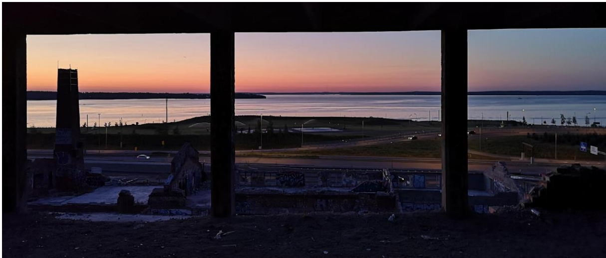
Kuva 3. Pispalan feimi, Näkymä huopakattotehtaan 2 kerroksesta Näsijärvelle. Matti L , 2021

Pispalan feimi (kuvat 3 ja 4) on inspiroiva urbaaniympäristöä ja luontoa yhdistävä paikka Pispalanharjulla Tampereella. Se oli, ja on osaksi yhä edelleen säästyneiltä osiltaan eräänlainen urbaanin kesannon ja kaupunkimetsän risteymä, alakulttuurien 'kansanopisto'. Se sijaitsee yhdellä Tampereen korkeimmista paikoista kahden järven välissä. Karakteriltaan se on rosoinen, eräänlainen kansallisromanttinen post 2000-luvun Koli omaleimaisilla nykymaalauksilla päällystettynä.