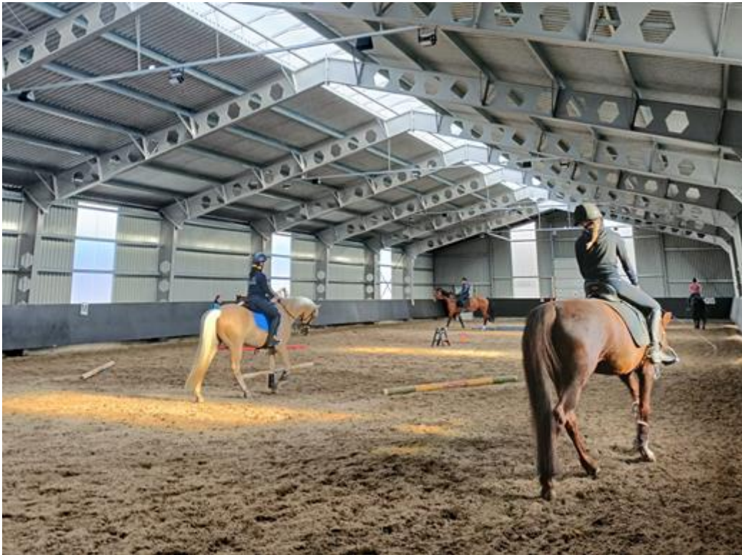
Kuva 3. Maneesi sisältä

Maneesi on käytössä keskimäärin 6—7 tuntia vuorokaudesta. Yhden tunnin aikana maneesia käyttää 6—12 henkilöä ja 6—8 hevosta. Siellä voidaan harrastaa sekä kouluratsastusta että esteratsastusta. Lisäksi hevosia voidaan treenata ihmisen seistessä maassa, esimerkiksi juoksuttamalla. Juoksuttaessa hevonen kulkee isolla ympyrällä ihmisen pidellessä juoksutusliinaa ympyrän keskellä.