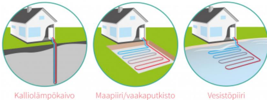
Kuva 5. Erilaiset lämmönkeruutavat (Nivos 2023.)

vaakatasoon maan alle tai vesistöön. Putkistoissa kiertää lämmönsiirtoneste, joka ottaa talteen lämpöä maaperästä. Kuvassa 5 on periaatepiirroksat erilaisista lämmönkeruutavoista.