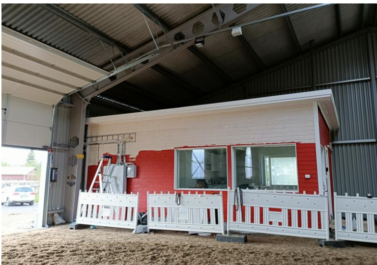
Kuva 2. Sosiaalitila ulkoa

Kuvassa 2 sosiaalitila katsottuna ratsastusalan puolelta. Sosiaalitila toimii myös katsomona, josta voi seurata ratsastusalalla tapahtuvaa harjoittelua.