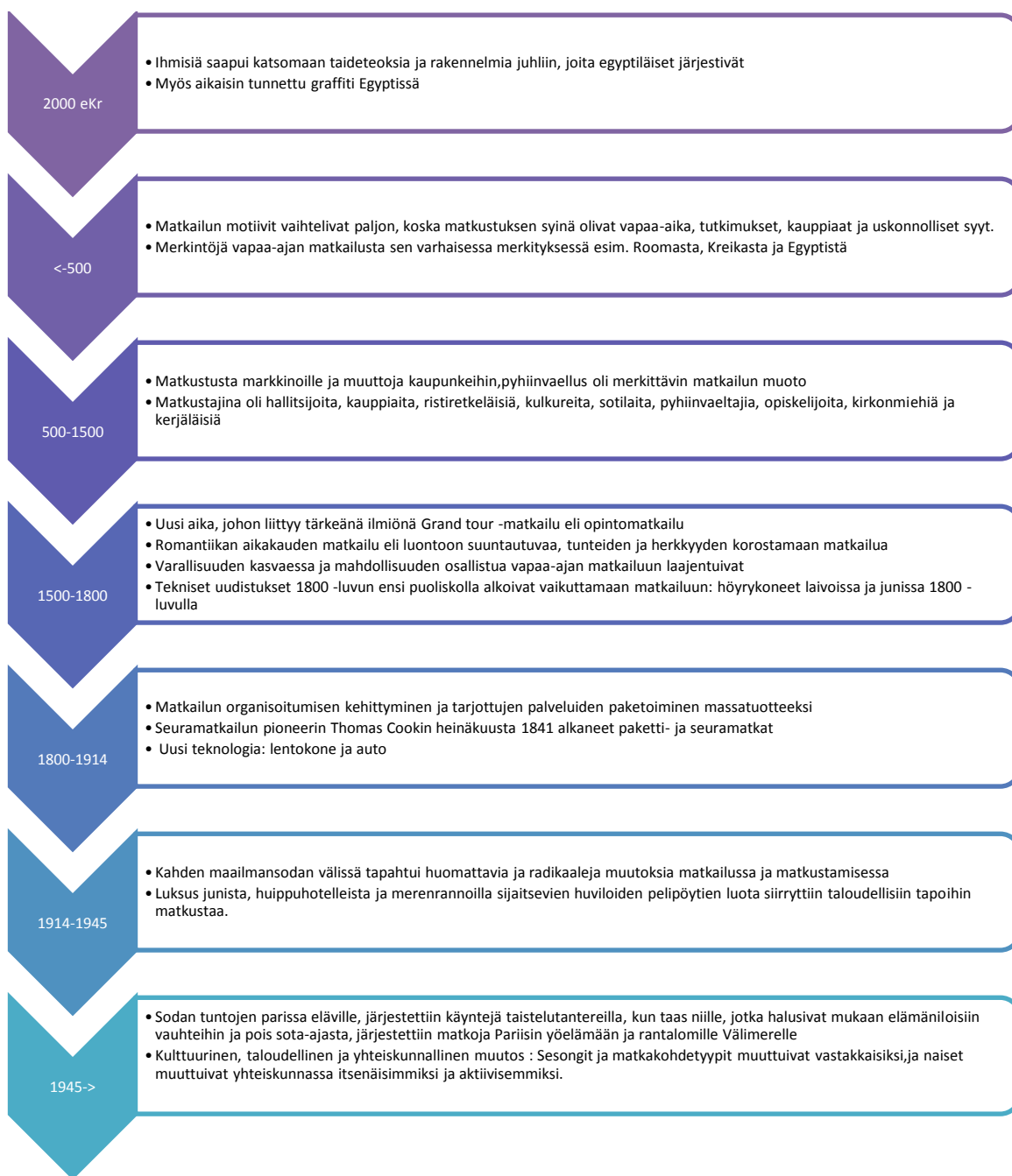
KUVIO 1. Aikajana matkailusta historiassa

Historiasta löytyy joidenkin matkatoimistojen Facebook –sivuilta kauniita ja mielenkiintoisia kuvia ja muutamalla sanalla kerrottuna kohokohtia historiasta. Viidestä matkatoimistosta kolmella oli merkittynä erikseen Facebook –sivuille yrityksen perustamisvuosi ja sen jälkeen merkittynä joitakin tärkeitä vuosia ja vuosikymmeniä, jolloin matkatoimistoilla tapahtui jotain uutta ja erikoista kuten esim. sähköisen varausjärjestelmän käyttöönotto. (Facebook 2014a, b, c, d & e.)