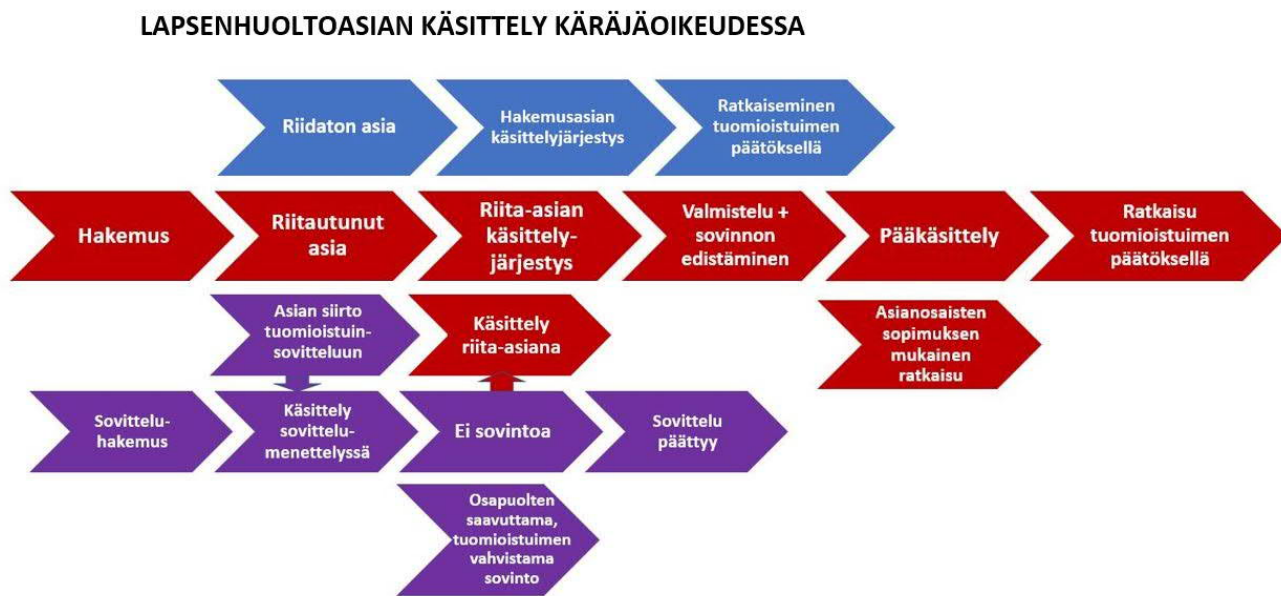
Kuvio 3: Lapsenhuoltoasian käsittely käräjäoikeudessa. (Mukaillen Linnanmäki 2020, 416.)

on oikeudenkäymiskaaren 5 luvun 19 §:n mukaan velvollisuus ottaa lapsiriidan käsittelyssä esiin mahdollisuus sovintoratkaisuun. Mikäli vanhemmat pääsevät oikeudenkäynnin aikana sopuun, tuomari voi antaa asiassa vanhempien sopimuksen mukaisen päätöksen 67 . Muussa tapauksessa käräjäoikeus tekee käsittelyn päätteeksi päätöksen asiassa. 68 Opinnäytetyössä tutkitaan nimenomaa riitautuneita lapsenhuoltoasioita. Sovittelumenettely on rajattu tutkimuksen ulkopuolelle, mutta kuviossa 1 on havainnollistettu violeitein nuolin myös tuomioistuinsovitte- lumenettelyn kulkua, sillä riitautunut asia voidaan siirtää tuomioistuinsovitte- lukseen, tai palauttaa takaisin riita-asioiden käsittelyyn, mikäli sovittelu päättyy tuloksettomana. 69