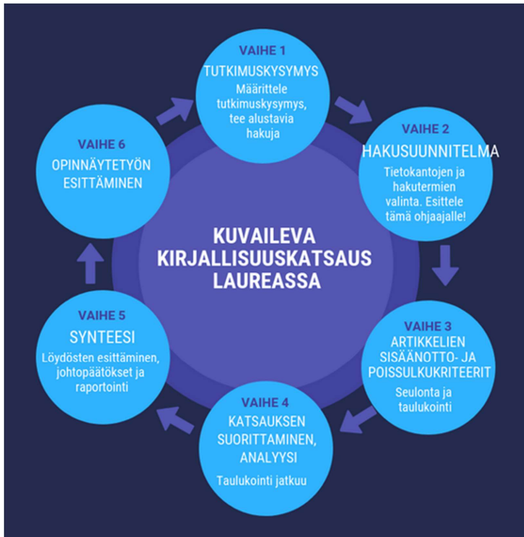
Kuvio 4: Kuvaileva kirjallisuuskatsaus Laurea-ammattikorkeakoulussa. Canvas, (Tiedonhankinnan työtila, 5.3)

Alla malli Laurea-ammattikorkeakoulussa käytössä olevasta, kuvailevan kirjallisuuskatsauksen prosessista (Kuvio 4).