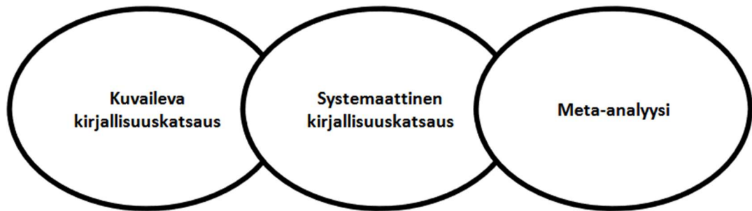
Kuvio 2: Kirjallisuuskatsausten jaottelu (Salminen 2011, 6).

Opinnäytetyö toteutetaan soveltaen kuvailevan kirjallisuuskatsauksen menetelmää. Siinä hyödynnetään suomalaisen median artikkeleita, uutisia ja ajankohtaisohjelmia. Opinnäytetyössä käytettävä materiaali dokumentoidaan hyvien tieteellisten periaatteiden mukaisesti. Aineiston keruussa toteutetaan hakustrategiaa. Haut toteutetaan pääsääntöisesti suomalaisen median sivustoilta, kuten Helsingin Sanomat ja YLE. Myös hakukoneita ja tietokantoja hyödynnetään. Niiden käytön haasteena on rajaus suomalaisen median esille nostamiin asioihin. Hakuosoina käytetään esimerkiksi varhaiskasvatusta, lastenhyvinvointia, päiväkotia ja pedagogiikkaa. Ideana on pitää materiaalin sisältö tarkoituksenmukaisena niin, että se vastaa tutkimuskysymykseen.