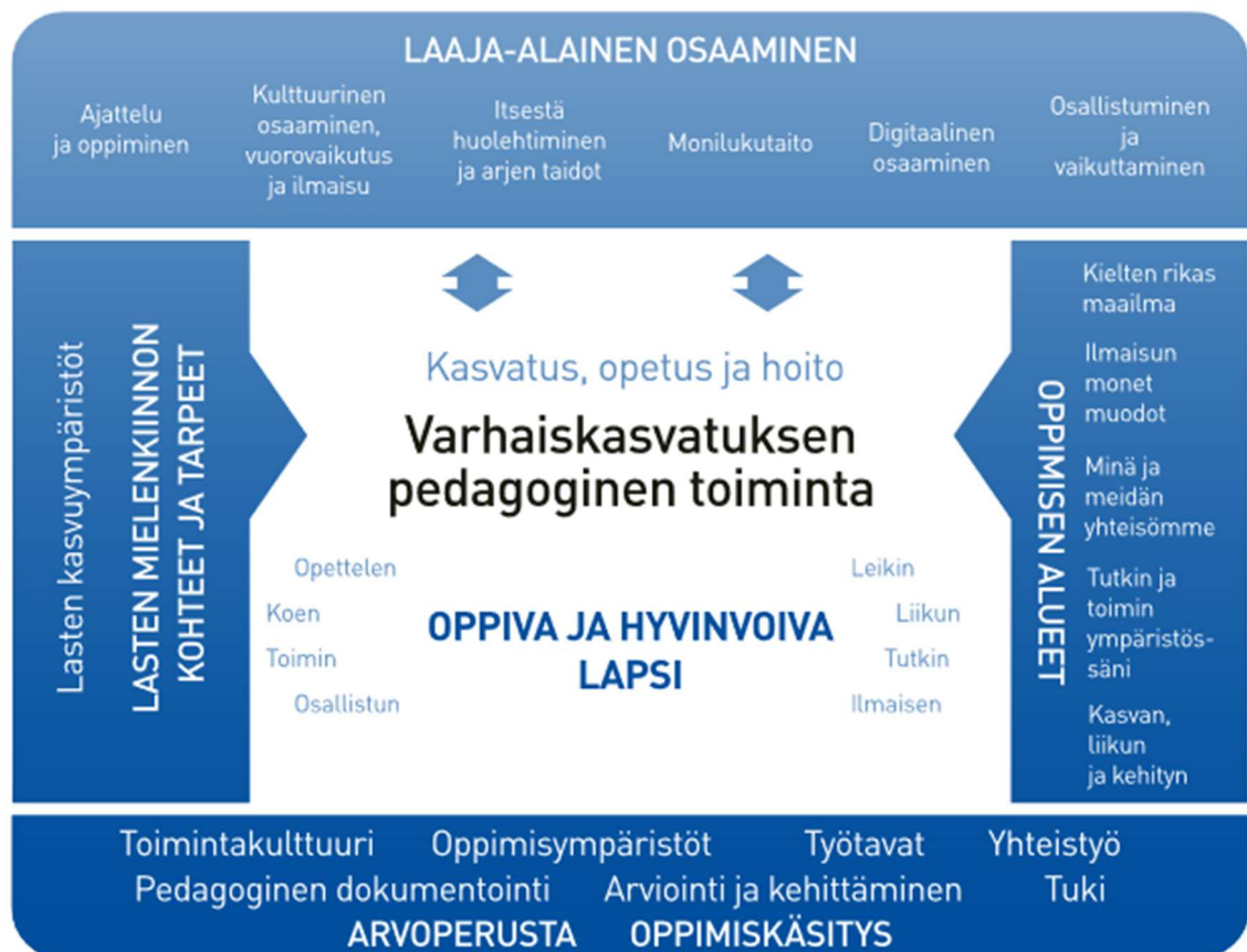
Kuvio 1: Varhaiskasvatuksen pedagogisen toiminnan viitekehys. (Varhaiskasvatussuunnitelman perusteet 2022, 38).

Kokonaiskuvan luomista pedagogisesta viitekehyksestä auttaa Varhaiskasvatussuunnitelman perusteissa (2022, 38) oleva kuva. Siitä voi helposti katsoa, mitä kaikkea pedagogisen toiminnan tulee pitää sisällään. Sen perustana on varhaiskasvatuksen arvoperusta ja oppimiskäsitys. Melkein kuin talon perustus. Se rakentuu oppimisen alueiden, sekä lasten mielenkiinnon kohteiden ja tarpeiden varaan. Nämä toimivat talon seininä. Ja sen kattaa lapselle varhaiskasvatuksessa rakentuva laaja-alainen osaaminen. Keskellä on oppiva ja hyvinvoiva lapsi, joka saa tarvitsemansa kasvatuksen, opetuksen ja hoidon. Samalla kun hänelle taataan turvallinen ja terveellinen ympäristö. Tila, jossa hän voi oppia uutta, kehittää jo olemassa olevaa osaamistaan ja yksinkertaisesti voida hyvin. Kuvio varhaiskasvatuksen pedagogisen toiminnan viitekehyksestä löytyy alta (Varhaiskasvatussuunnitelman perusteet 2022, 38).