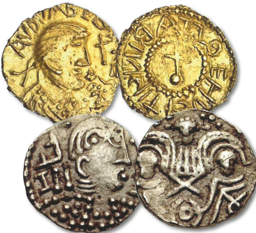
Kuva 2. Anglosaksien thrymsa-rahvoja. Ylinnä Kentin hallitsija Eadbald'in (616–640) Lontoossa aikavälillä 620 – 635 lyöty thrymsa / shilling. Paino 1,28 g noin 67% kultaa, halkaisija noin 12 mm. Arvo noin 60 000 €. Alinna heikkolaatuisesta kullasta aikavälillä 650 – 675 lyöty thrymsa / shilling. Paino 1,25 g, halkaisija 11,5 mm. Arvo noin 3 000 – 4 000 €.

Roomassa oli käytössä libra -niminen painoyksikkö, joka oli noin 328,9 grammaa ja joka jakaantui 12 unciaan. Roomalaisten Britanniaasta poistumisen jälkeen (vuonna 410) väheni talouden yleisen hiipumisen myötä myös rahan käyttö ja talouselämä taantui melko primitiiviseen vaihtokauppaan ja omavaraiseen maatalouteen.