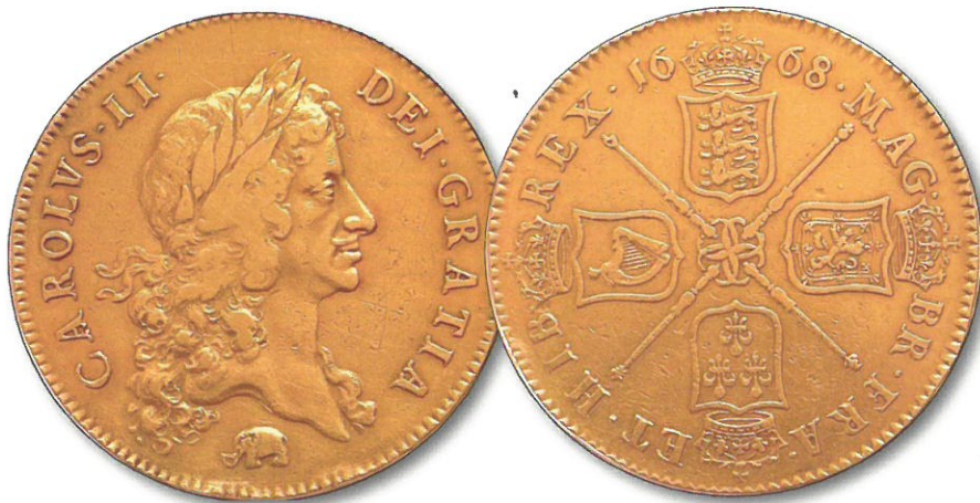
Kuva 13. Charles II (1660 - 1685), kultainen viiden guinean raha vuodelta 1668, paino 41,94 g 916 o/oo kultaa, halkaisija 37 mm. Lyöty Lontoon rahapajassa. Arvo noin 8 000 €.

Vuonna 1696 alkoi suuri rahakannan uusimishanke, jolla kerättiin pois suuret määrät vanhempia, osin huonolaatuisia ja ahkerasti väärennettyjä käsin lyötyjä hopearahoja ja korvattiin ne laadukkailla ja konelyödyillä uusilla rahoilla.