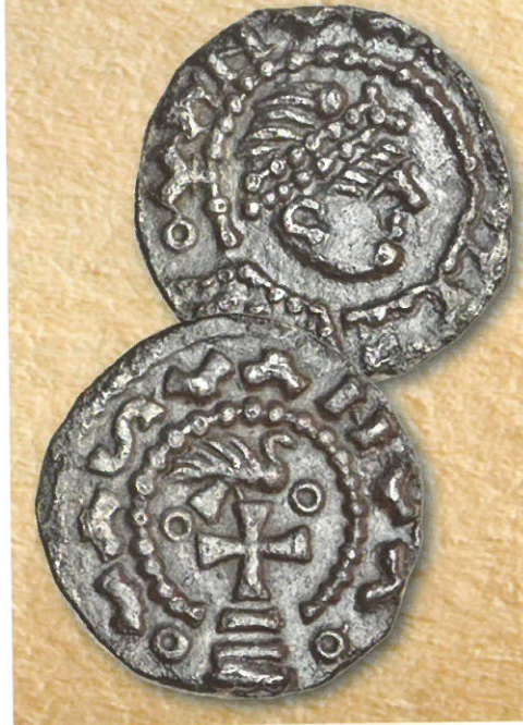
Kuva 3. Anglosaksien ajanjaksona 680 – 710 lyöty sceatta. Paino 1,17 g, halkaisija noin 11–12 mm. Arvo noin 250 €.

hopea-aihiolle lyötyjen denier-rahojen (nimitys tulee suoraan vanhasta roomalaisesta denarista) tuotannon 760-luvun lopulla. Aktiivinen kaupankäynti Kaarle Suuren frankkien valtakunnan kanssa sai anglosaksit seuraamaan esimerkkiä ja kopioimaan frankkien valuuttajärjestelmän, jossa 12 denieriä (pennya, d) oli sou (shillinki, s) ja 240 denieriä tai 20 souta vastasi libraa (pound, £).