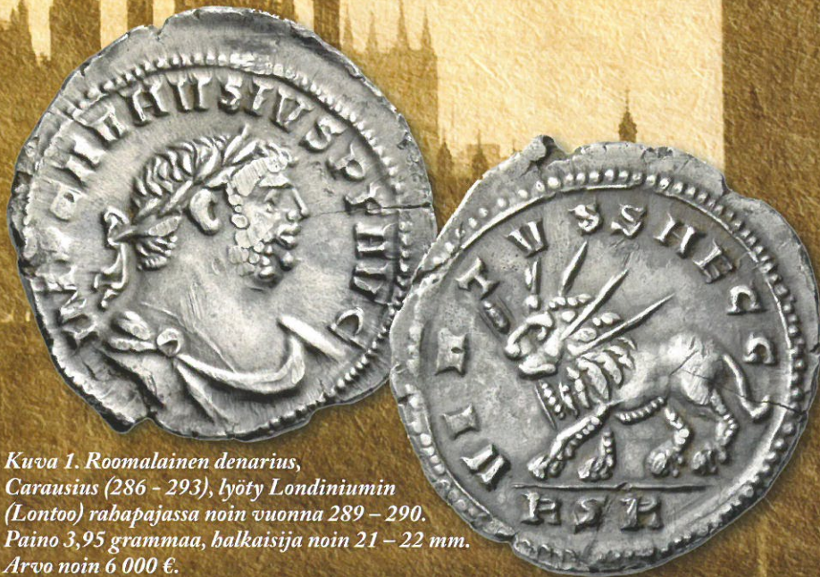
Kuva 1. Roomalainen denarius, Carausius (286 - 293), lyöty Londiniumin (Lontoo) rahapajassa noin vuonna 289 - 290. Paino 3,95 grammaa, halkaisija noin 21 - 22 mm. Arvo noin 6 000 €.