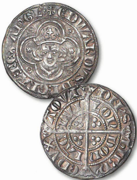
Kuva 8. Kuningas Edward I (1272 – 1307), groat eli 4 pence ajalta 1279 – 1307. Paino 5,7 g ja halkaisija 27 mm. Arvo noin 2 500 €.

1350-luvulta lähtien tuotettiin Englannissa kultarahoja erittäin monipuolisesti (taulukko alapuolella):