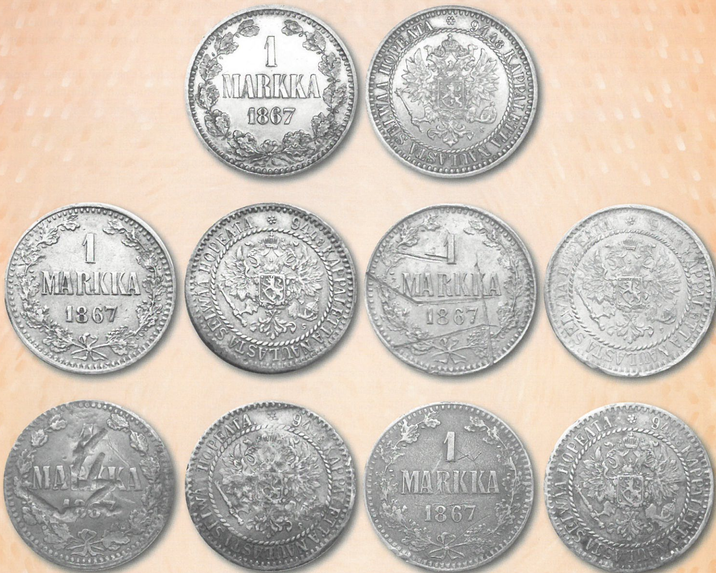
Kuva 4. Kuvakavalkadi aidosta vuoden 1867 hopeamarkasta (ylinnä), Timo Ruotsalaisen väärennöksistä (keskirivi) sekä kirjoittajan kappaleista (alin rivi). Rabojen painot ovat kuvan järjestyksessä: aito 5,18 g, 5,27 g, 4,47 g, 5,09 g ja 4,72 g.

halkaisija poikkeaa hieman ylöspäin norminmukaisesta 24,0 millimetristä ollen 24,1 – 24,3 mm. Väärennökset eivät myöskään ole täysin pyöreitä, vaan niiden halkaisija vaihtelee eri kohdissa.