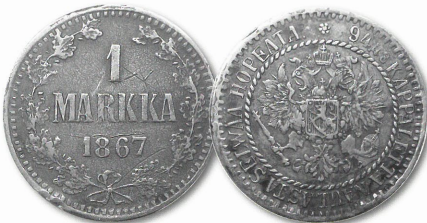
Kuva 7. 1 markka 1867 väärennös kirjoittajan kokoelmista. Huomaa arvopuolen pinnan rosoisuus, joka on tyypillinen puute valetuissa väärennteissä.