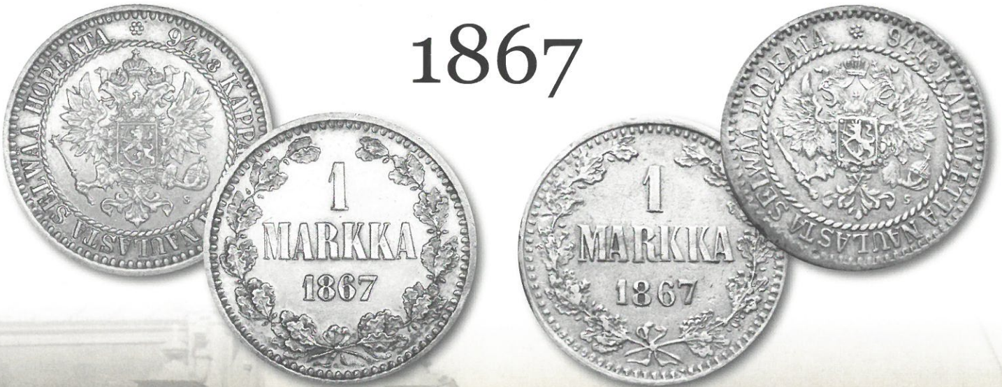
Kuva 1. 1 markka 1867, vasemmalla aito raha (molemmiin puolin 88 reunahelmeä), oikealla väärennetty raha (molemmiin puolin 85 reunahelmeä). Väärennös Timo Ruotsalaisen kokoelmista. Kuvien muokkaus ja yhdistely Jorma J. Imppola, SeAMK.