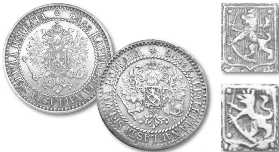
Kuva 3. Vasemmalla aidon (88 reünahelmeä) ja oikealla väärennetyt 1 markan tunnuspuoli. Oikeassa reunassa leijonavaakunan osassuurennoksia; aidon ylhäällä, väärennetyt alhaalla.

Väärien rahojen painot ovat vaihtelevia ja poikkeavat aidosta. Väärennöksen painot vaihtelevat välillä 4,47 - 5,27 grammaa, kun sen pitäisi olla 5,18 grammaa. Toisaalta painoeron havaitseminen vaatii tarkkuusvaakaa. Myös väärennösten