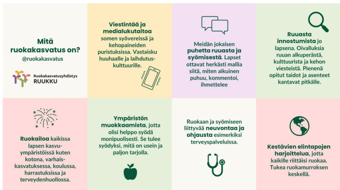
Kuvio 5. Mitä ruokakasvatus on? (Ruokakasvatusyhdistys Ruukku, 2023.)

Laajasti määriteltynä ruokakasvatus tarkoittaa kaikkea ruokaan ja syömiseen liittyvää opetusta, neuvontaa, ohjausta ja viestintää. Ruokakasvattaminen on läsnä joka päivä, kun pohdimme, mitä syömme, mitä laitamme ruuaksi, miten ruuasta puhumme muille ihmisille ja kun keskustelemme ruuasta tai kohtaamme ruoka-aiheita mediassa. (Ruokakasvatusyhdistys Ruukku, 2023.)