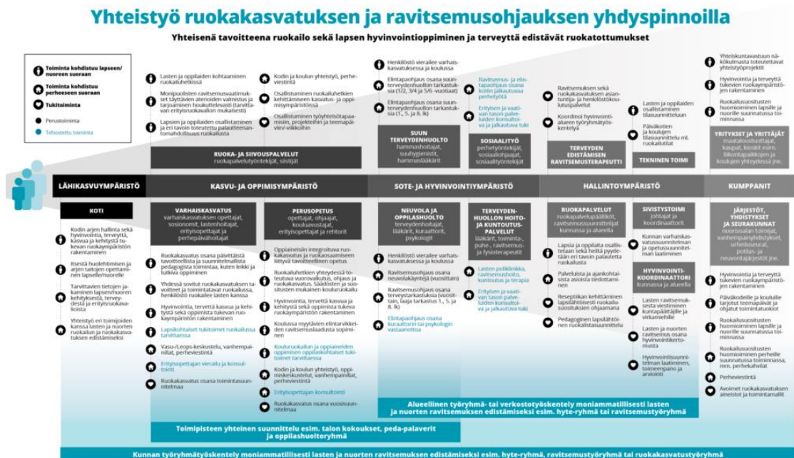
Kuvio 6. Ruokakasvatuksen moniammatillinen joukkue. (Ruokakasvatustyhdistys Ruukku, 2023.)

On tärkeää, että tämä joukkue, joka koostuu muun muassa sosiaali- ja terveydenhuollon ammattilaisista, varhaiskasvattajista, opettajista, ruokapalveluiden työntekijöistä ja valmentajista, tekee työtään samaan suuntaan. Lasten ruokakasvatusta ja ravitsemusterveyden edistäminen eivät saa jäädä rakenteellisen muutoksen jalkoihin, vaan yhteistyötävät, toimijat ja vastuut on tunnistettava, jaettava ja kirjattava selkeästi niin kunnissa kuin hyvinvointialueilla. (Ruokakasvatustyhdistys Ruukku, 2023.)