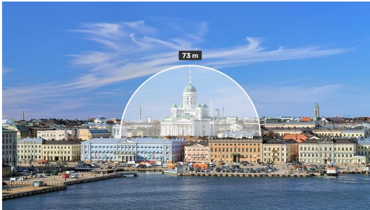
Kuvio 2: Suomalaisten ruokahävikki suhteutettuna Tuomiokirkon kokoon (Tuominen, 2023).

Kouluissa ruokahävikki on keskimäärin 20 %, kun taas kotitalouksissa sama luku on noin 6 %. Koulukeittiöiden ruokahävikki aiheuttaa vuodessa suurin piirtein saman verran päästöjä kuin 70 000 henkilöautoa. Euroopan komission määrittelemien tavoitteiden mukaan vuoteen 2030 mennessä ruokahävikki tulisi puolittaa. (Kouluruokakilpailu, 2019.)