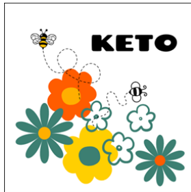
Kuvio 3: Ammattiopisto Livessä toteutettavan Opetushallituksen rahoittaman Keto-hankkeen kuva. (Live-säätiö, 2023.)

osaamisen hankkiminen ja osaamisen tunnustaminen. Kaikki ilmasto-osaamisen toimenpiteet ja tietous tuodaan konkretian ja arkitiedon tasolle, joka palvelee erityistä tukea tarvitsevien henkilöiden tiedon omaksumista ja sen saavutettavuutta. Osaamisen tunnustamista tukemaan luodaan osaamismerkistö, joka muodostetaan pienistä osaamiskokonaisuuksista. Osaamismerkkejä luodaan ja niitä suoritetaan eri oppimisympäristöissä (oppilaitos, KOS-paikat ja muut ympäristöt) (Live-säätiö, 2023).