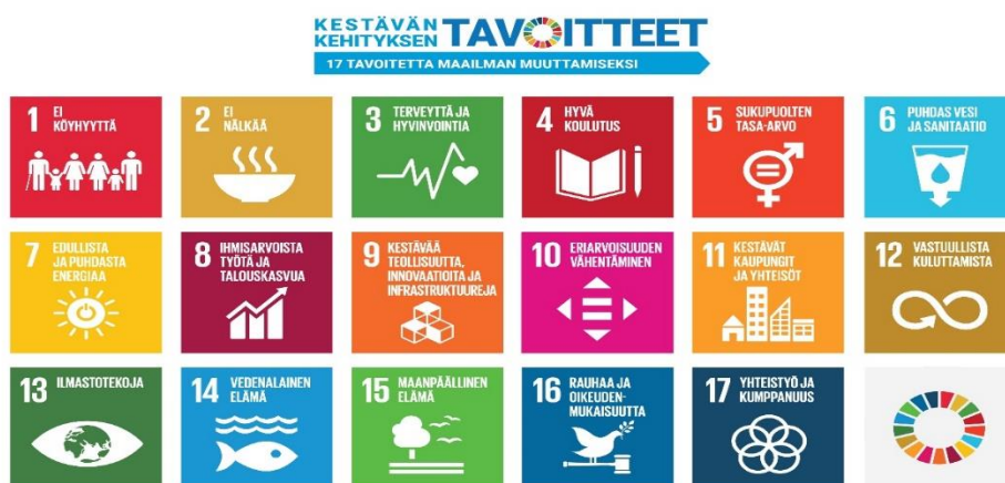
Kuvio 4: Kestävän kehityksen tavoitteiden kuvakkeet. (Suomen YK-liitto, 2023.)

Kestäväan kehityksen tavoitteita on 17 ja alla näistä kuvakkeet