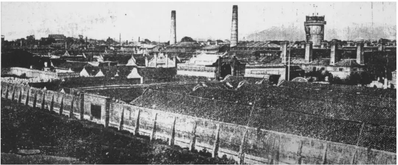
Kuva 7. Jiangnan:in rahapaja Nanjingin kaupungissa. Tiloissa toimii nykyään mm. rahamuseo.

Kantonin provinssin jälkeen ryhtyivät muutkin provinssit yksi toisensa jälkeen valmistamaan ja laskemaan liikkeelle omia dollaristandardin mukaisia rahojaan. Joukkoon liittyi myös Jiangnanin provinssi yhteistyössä jo mainitun Heaton and Sons -rahapajan kanssa. Vuonna 1896 Liu Kunyi, Liangjiangin varakuningas, perusti Nanjing:in kaupunkiin “Jiangnan Yleisen Hopeanvalurahapajan” ja vuonna 1897 Heaton and Sons suunnitteli ja valmisti uusien Kiang Nan:in provinssin 5, 10, 20, 50 fen'in ja 1 dollarin hopearahojen meistit ja löi niillä joitakin koelyöntejä.