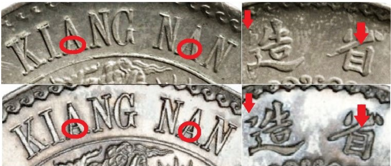
Kuva 9. Arvpuolen sanojen "KIANG NAN" ylemmän käyttörahavariantin A-kirjainten poikkiviivat ovat heiveröiset ja alemman koerahavariantin selkeät. Tunnuspuolen provinssia tarkoittavista kirjoitusmerkeistä, jonka vasemmanpuoleisen merkin vasemmassa yläkulmassa oleva kuvio on käyttörahavariantissa pelkistetty, mutta alemmassa koerahavariantissa nuolenpään muotoinen. Oikeanpuoleisen merkin rungon yläosa on ylemmässä käyttörahavariantissa avoin,