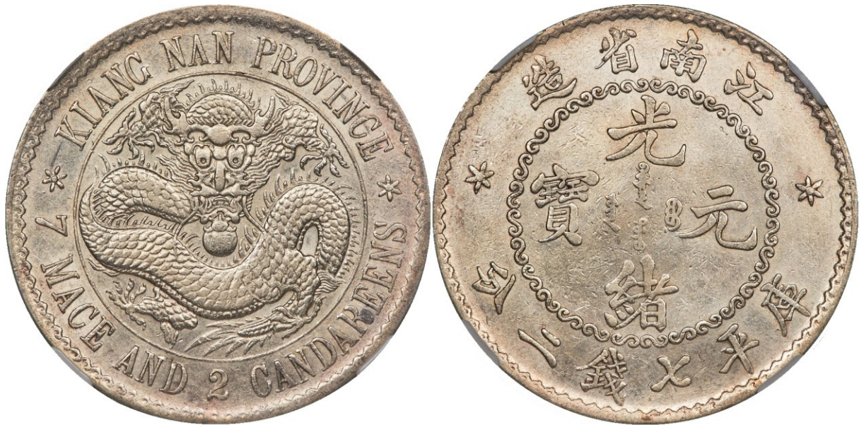
Kuva 11. Jiangnan (KIANG NAN). Keisari Kuang-hsü:n nimissä lyöty hopeinen dollari ilman vuosilukua (1898). Halkaisija 39 mm, paino noin 27 g. Lyöty Nanjing:in rahapajassa, (Y#145.1, reunassa kalanruoto-ornamentti). Kuvien muokkaus ja yhdistely Jorma Imppola, SeAMK.

Heritage HKINF World Coins & Ancient Coins Signature Auction Hong Kong 3087 18.-19. joulukuuta 2020, kohde 30131, kuntoluokka UNC details, environmental damage. Nanjing mint, KM-Y145.1 Myyntihinta oli 200 000 USD + 20% = 240 000 USD. Koska raha oli ”släbätty”, ei siitä ollut saatavilla tarkkaa painotietoa.