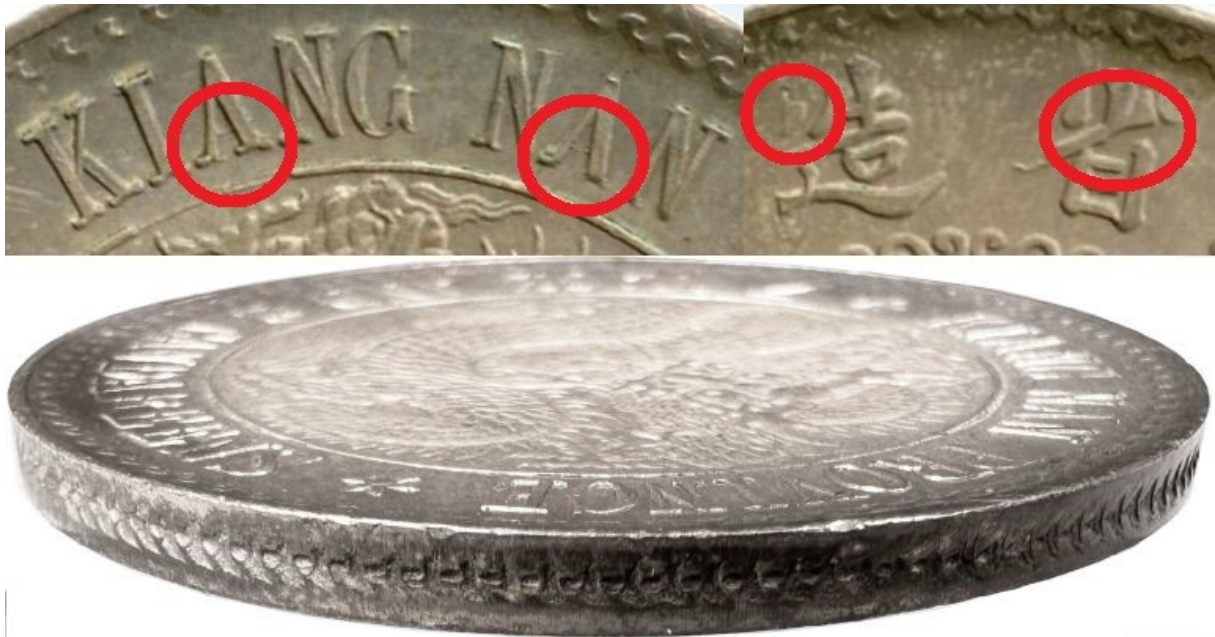
Kuva 2. Jiangnan (KIANG NAN). Keisari Kuang-hsü:n nimissä lyöty hopeadollari ilman vuosilukua (1898). Havainnekuva rahan yksityiskohtien tarkempaan tutkimiseen. Kuvalähde: https://www.holmasto.fi/ Kuvien muokkaus ja yhdistely Jorma Impola, SeAMK.

Kuvassa 2 ylhäällä vasemmalla osasuurennus arvopuolen sanoista "KIANG NAN", jonka A-kirjainten poikkiviivat ovat miltei näkymättömissä. Ylhäällä oikealla osasuurennus tunnuspuolen provinssia tarkoittavista kirjoitusmerkeistä, jonka vasemmanpuoleisen merkin vasemmassa yläkulmassa oleva kuvio on pelkistetty ja oikeanpuoleisen merkin rungon yläosa on avoin. Alinna rahan reunan kalanruotokuvio. Tarkempi vertailu koerahavariantin kanssa kuvassa 9.