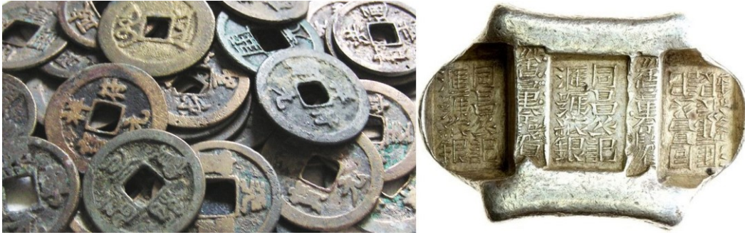
Kuva 4. Vanhoja pronssista valettuja cash-rahoja ja hopeinen tael-harkko. Kuvien muokkaus ja yhdistely Jorma Impola, SeAMK.

Uusien desimaalirahojen tuottamiseen tarvittavasta teknologiasta, rahapajan rakentamisesta ja varustamisesta järjestettiin vuonna 1887 tarjouskilpailu, jonka voitti englantilainen Heaton and Sons -rahapaja (josta tuli myöhemmin Birminghamin rahapaja). Heaton and Sons -rahapajan osaamisen avulla perustettiin Kwang-Tung:iin (Kantoniin) Guangdong:in kaupunkiin valtava rahapaja, josta tuli aikanaan maailman suurin rahapaja 90 lyöntikoneellaan ja sen tuotanto oli suurimmillaan 2,7 miljoonaa metallirahaa päivässä. Rahapaja avattiin virallisesti 25. toukokuuta 1889 ja tämä englantilaisten suunnittelema ja kiinalaiseen tyyliin rakennettu kokonaisuus oli tullut maksamaan miljoona dollaria.