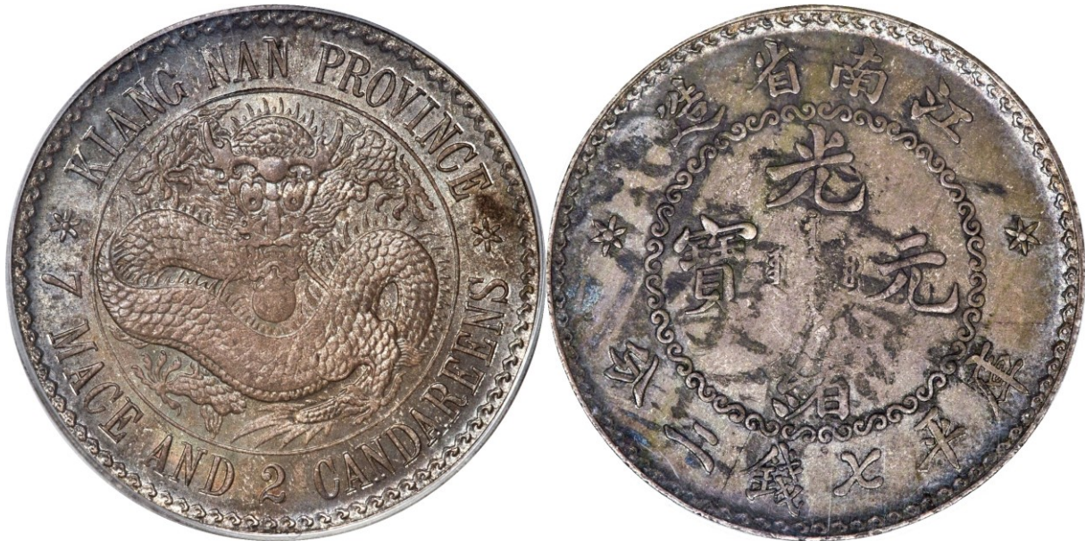
Kuva 12. Jiangnan (KIANG NAN). Keisari Kuang-hsü:n nimissä lyöty hopeinen dollari ilman vuosilukua (1897). Halkaisija 39 mm, paino noin 27 g. Lyöty Nanjing:in rahapajassa, (KM#Y145.1, reunassa kalanruotokuvio).

Vertailtaessa artikkelin vasta myytyä rahaa huutokauppaesimerkkeihin on todettava, että Holmastolla myyty kappale on molempia edellä esiteltyjä hienompi kappale, ja verratessa erityisesti kuvan 12 rahaan, joka likaisuudestaan huolimatta saavutti 240 000 USD hinnan, tuntuu artikkelimme suomenenätysrahan varsin kova reilun 370 000 euron hinta kuitenkin aivan realistiselta.