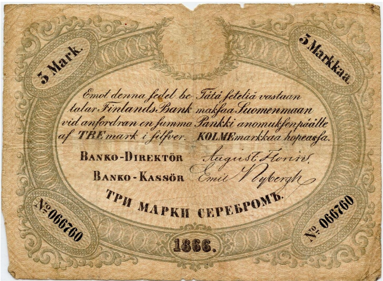
Kuva 8. 3 markkaa 1866 ”valkoinen kotka” No 093501 etupuoli. Kuvälähde: https://www.numisbids.com/n.php?p=lot&sid=4373&lot=564 Kuvan muokaus Jorma Impola, SeAMK.

Holmaston huutokaupassa 154 myytiin 12. joulukuuta 2020 kohdenumerolla 564 ”3 markkaa 1866 Valkoinen kotka. Florin - Nybergh. № 066760. H.39. 96-97 x 131-133 mm. Erittäin harvinainen, aiemmin tunnettu vain 3 kpl, joista 2 julkisissa kokoelmissa. Nyt myytävä 4. kappale ei ole aiemmin ollut myynnissä. / 3 mark 1866 Vit örn. Ytterst sällsynt, av 4 kända ex 2 är i offentliga samlingar. / 3 markkaa 1866 White Eagle. Extremely rare note. Only 4 specimens are known and 2 of them are in museum collections” Kohteen kunnoksi oli arvioitu 1? (skandinaavisen asteikon mukaan) ja sen lähtöhinta oli 30 000 €. Seteli myytiin vasarahintaan 42 000 € + 22 % ostoprovisio eli nettohintaan 51 240 €.