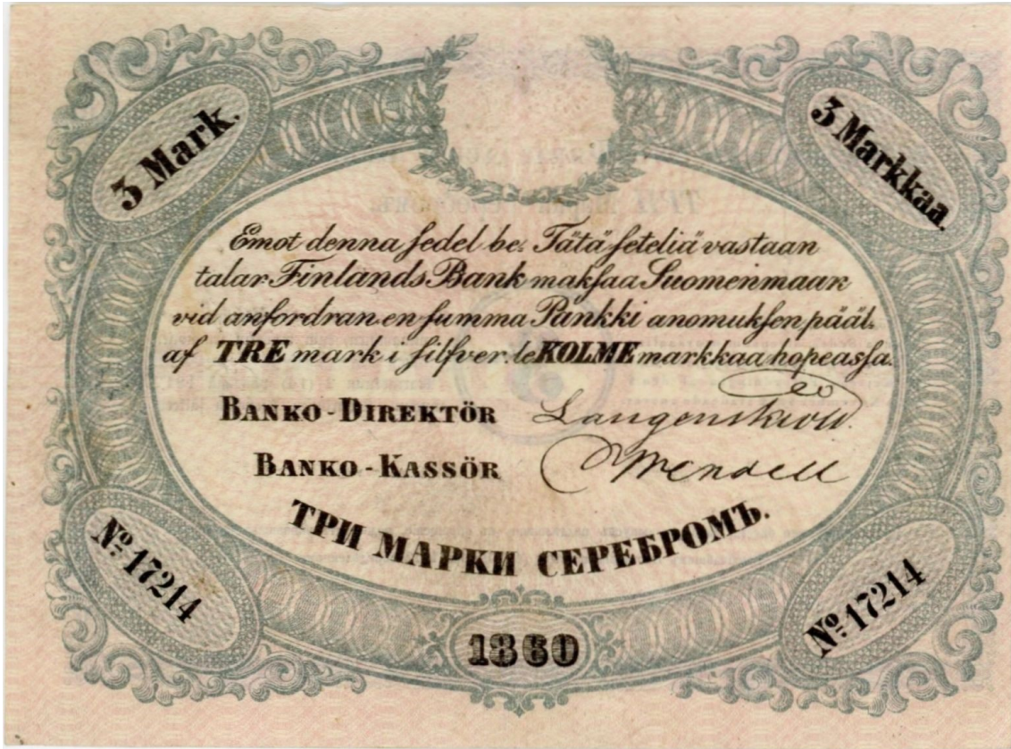
Kuva 3. Aidon Katz:in huutokaupassa 29. tammikuuta 2023 myydyn 3 markan setelin 1860 No 17214 etupuolen kohdekuva. Huomaa kuvan epätarkkuus verrattuna kuvaan 1. Kuvalähde: https://www.numisbids.com/n.php?p=lot&sid=6453&lot=1643 Kuvan muokkaus Jorma Imppola, SeAMK.

eräs hyvin harmillinen piirre – eli mitenäs sitten, kun aito seteli on kaupan? Tästä kuvaava esimerkki havainnollistui, kun tämä samainen seteli tuli jälleen kaupan 28.-29. tammikuuta 2023 Katz Coins Notes & Supplies Corp. E-Auction 76:een kohdenumerolla 1643 jälleen 5 € lähtöhintaan ja se myytiin 29. tammikuuta vasarahintaan 3 400 € + 20 % komissio = 4 080 €.