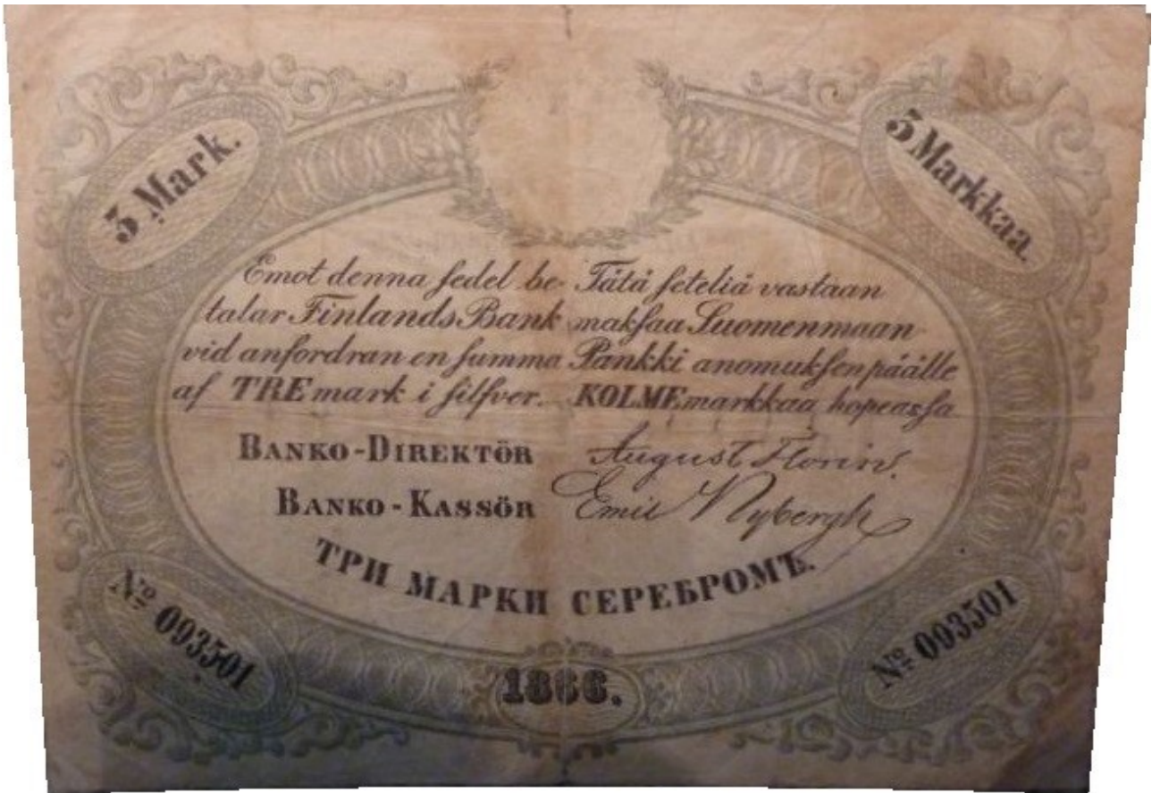
Kuva 9. Kopioidun 3 markan setelin 1866 ”valkoinen kotka” No 093501 etupuoli.

Mitä kummaa, oliko Kansallismuseo taloudellisissa paineissaan joutunut laittamaan tämän harvinaisuutensa myyntiin - onko valtiontalouden raaka tervehdyttäminen kovin säästötoimin jo alkanut? No ei todellakaan, joku oli tehnyt jälleen netistä löytämänsä kuvan avulla oman ”reproductioninsa” tästä harvinaisuudesta ja kuinkas ollakaan, sitä oltiin heti tyrkyttämässä aitona ostettavaksi huuto.net:issä. Netin ”numismatiikkapoliisit” minä mukaan lukien olimme heti kärppänä liikkeellä, ja pian katosivat sekä tämä myyntikohde sekä sen myyjä huuto.net:istä.