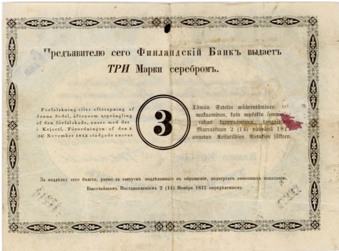
Kuva 4. Aidon Katz:in huutokaupassa 29. tammikuuta 2023 myydyn 3 markan setelin 1860 No 17214 taustapuolen kohdekuva. Huomaa kuvan epätarkkuus verrattuna kuvaan 2. Kuvalähde: https://www.numisbids.com/n.php?p=lot&sid=6453&lot=1643 Kuvan muokkaus Jorma Imppola, SeAMK.

Heti, kun huutokauppalista kohdekuvineen tuli julki, huomasi suomalainen keräilijäyhteisö sen, että kyseisessä huutokaupassa oli muiden suomalaisten seteleiden joukossa myynnissä 3 markkaa 1860, 10 markkaa 1898 ja 10 markkaa 1945 Litt B Spécimen, joista on tehty ja kaupiteltu massoittain kopioita. Tämä luonnollisesti langetti ikävän epäilyksen siemenen kohteiden aitoudesta, jota erityisesti 3-markkaisen huutokauppakuvan epätarkkuus vain lisäsi, vaikka kaikki kolme epäilyllä ollutta seteliä olivat aitoja.