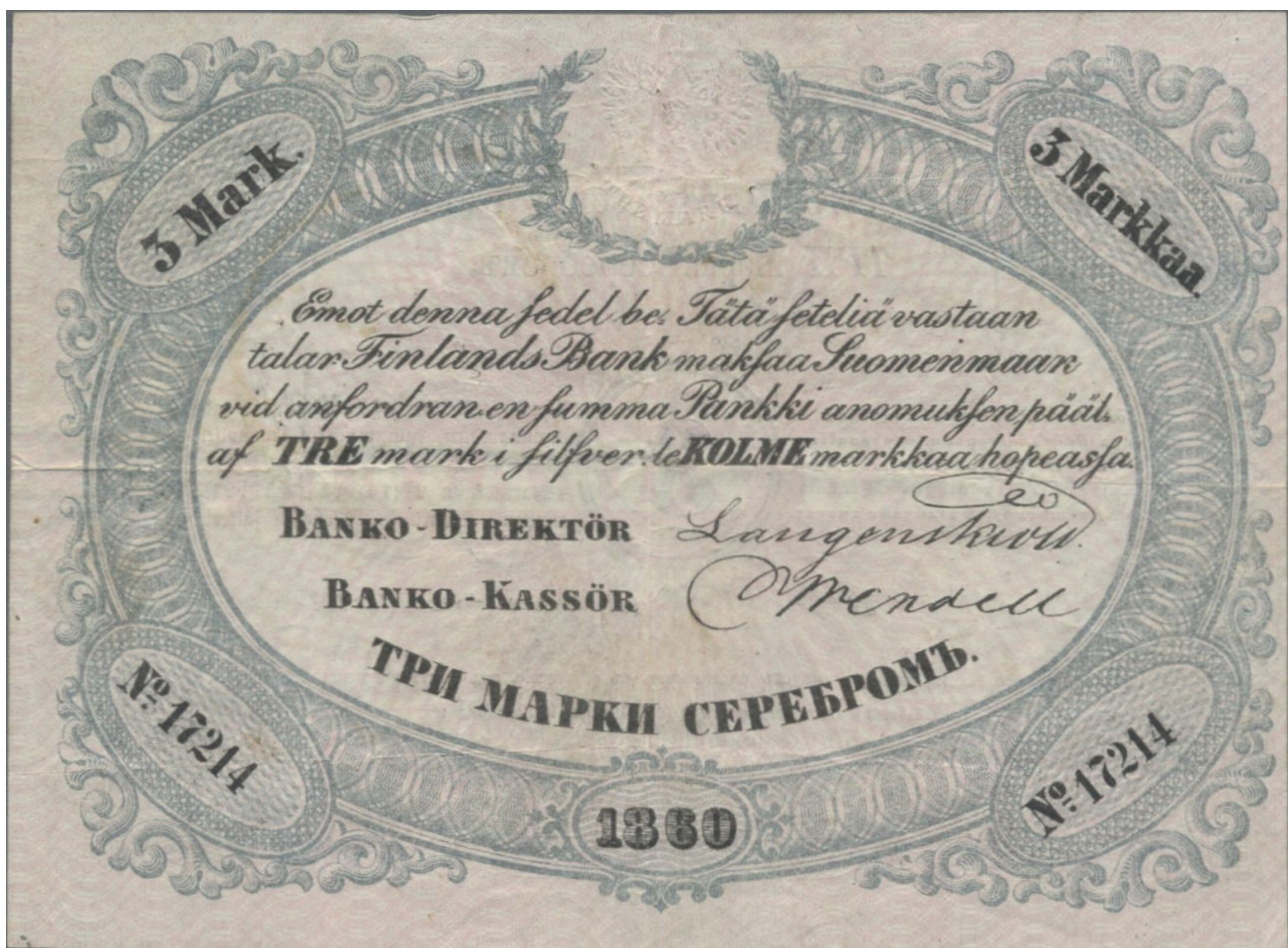
Kuva 1. Aidon 3 markan setelin 1860 No 17214 etupuoli.

Hyvin kuvaava ja myös surullinen on suomalaisen vuoden 1860 3 markan setelin No 17214 tarina. Kyseinen seteli oli kaupan 8. lokakuuta 2019 Auktionshaus Christoph Gärtner GmbH & Co. KG:n huutokaupassa Sale #45 Banknotes Worldwide kohdenumerolla 1524. Kohteen lähtöhinta oli 900 € ja sen myyntihinta oli 2 500 € + 23,8 % + 2 € komissio = 3 097 €.