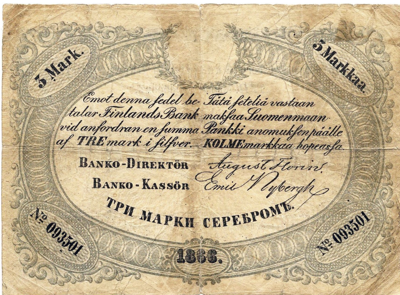
Kuva 6. Aidon 3 markan setelin 1866 ”valkoinen kotka” No 093501 etupuoli. Kuvälähde: https://en.numista.com/catalogue/note333586.html Kuvan muokkaus Jorma Impola, SeAMK.

Toinen, eri tavalla surullinen, esimerkki löytyy Suomen numismatiikan merkittävästä seteliharvinaisuudesta eli 3 markan setelistä 1866 ”valkoinen kotka”. Alun perin 3 markan seteleihin painettiin sen etupuolen yläosaan keskelle, vaalealle pohjalle, värittömänä koholeimana valtiollinen tunnus eli kotkavaakuna sekä arvomerkintä TRE MARK. Koholeimallisia seteleitä painettiin vuosina 1860 ja 1861. Koholeiman käytöstä päätettiin kuitenkin sen epäkäytännöllisyyden johdosta luopua, koska seteleiden kiertäessä se kuitenkin vähitellen muuttui näkymättömäksi ja aiheutti setelipaperiin reikiä ja repeämiä. Kotkakuvio näkyi vuoden 1864 ja 1866 seteleissä vain vaaleana, painamattomana alueena eli ”valkoisena kotkana”.