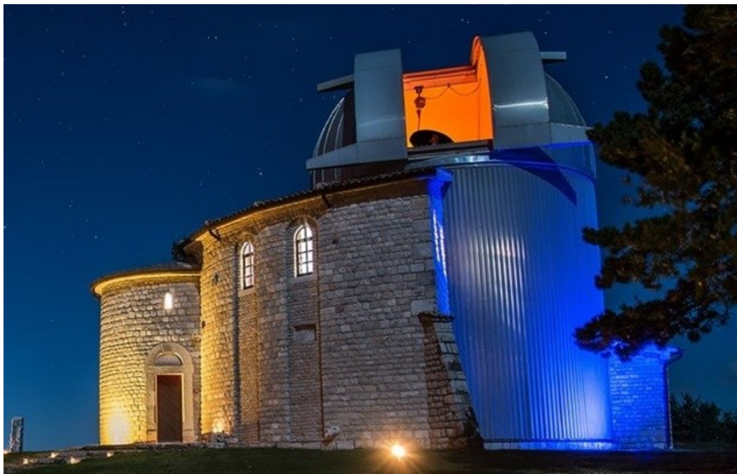
Kuva 11. Višnjanin observatorio. Perustettu vuonna 1992 yleiseksi observatorioksi.

Tämä maailman pienin kolikko on osa numismaattista kultarahasarjaa, mihin kuuluu myös 1 000 kunan nimellisarvoinen 1 troy-unssin painoinen kultakolikko, jossa on kuvattuna Višnjanin observatorio, joka kuuluu maailman viiden suurimman observatorion joukkoon, jotka tekevät maan läheisten objektien (Near Earth Objects) mittauksia.