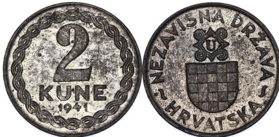
Kuva 6. Itsenäinen Kroatian valtio 2 kune 1941. Sinkkiä, paino 2,25 g., halkaisija 18,8 mm. Kuvälähde: https://www.acsearch.info/image.html?id=9224825 Kuvan käsittely Jorma J. Imppola, SeAMK.

Itsenäinen Kroatian valtio käsitti nykyisten Kroatian sekä Bosnian ja Herzegovinan valtioiden alueet. Itsenäinen Kroatian valtio otti virallisesti käyttöön myös oman rahayksikön eli 100 banicaan jakautuneen kunan. Lukuisten koerahojen ja liikkeelle laskemattomien rahojen lisäksi laskettiin liikkeelle 2 kunan sinkkiraha ja kaksi erilaista 500 kunan kultarahaa vuosiluvulla 1941.