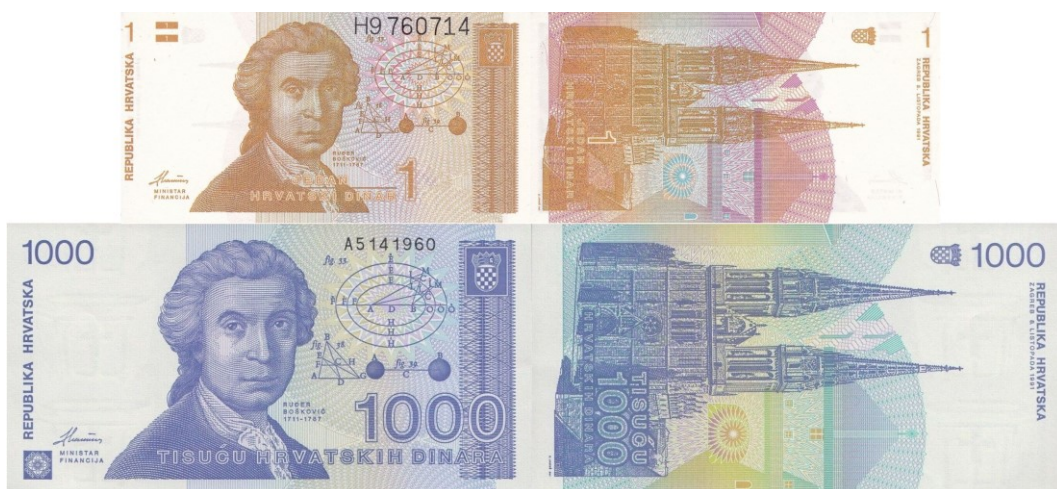
Kuva 1. Kroatian dinaarisetelimalli 1991. Liikkeelle laskettiin arvot 1, 5, 10, 25, 100, 500 ja 1 000 dinaaria. Kaikkien nimellisarvojen kuva-aiheet ovat samat, vain väreissä ja koossa on eroja. Kuvälähde: https://en.numista.com/catalogue/croatia-banknotes-1.html#c_croatie8952 Kuvien yhdistely ja käsittely Jorma J. Impkola, SeAMK.

Kuten olemme jo uutisista kuulleet, liittyi Kroatia tämän vuoden alussa euroalueeseen. Irtauduttuaan Jugoslaviasta vuonna 1991 otti Kroatia käyttöön oman dinaarinsa, jota riivasi reipas inflaatio, kuten muidenkin Jugoslaviasta irronneiden maiden valuuttoja, ja kyse olikin jonkinlaisesta välikausi/kuponkivaluutasta, mitä kuvaa myös se, että kaikki kroatian dinaarisetelit olivat varsin yksinkertaisia ja toistensa kaltaisia – metallirahoja ei otettu lainkaan käyttöön.