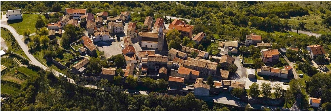
Kuva 8. Kroatiassa sijaitseva maailman pienimpänä pidetty kaupunki Hum.

Kroatian rahapaja perustettiin keskellä Kroatian vapautumissotaa 23. huhtikuuta 1993 ja Kroatian keskuspankki omistaa sen 100-prosenttisesti. Kroatian rahapajan hallintoneuvoston puheenjohtajan Damir Boltan mukaan ajatus maailman pienimmän rahan tekemisestä syntyi, koska ”Haluttiin luoda pysyvä muisto kunasta, ennen kuin se katoaa liityttäessä suureen euromaiden perheeseen. Tämän muutoksen ylpeänä juhlistamisena päätti Kroatian rahapaja luoda maailman pienimmän rahan – menestyksekkäästi. Rahan halkaisija on 1,99 mm ja paino 0,05 g. Myös teema on sopiva: 1 kunan kultaraha on omistettu Hum’in kaupungille, jota pidetään maailman pienimpänä kaupunkina”.