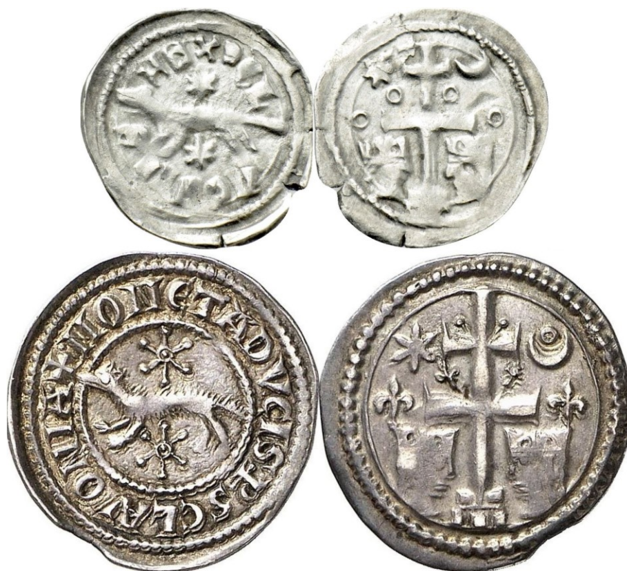
Kuva 4. Slavonian ensimmäisiä näätä-aiheisia rahoja. Kuvälähde: https://www.acsearch.info Kuvien yhdistely ja käsittely Jorma J. Imppola, SeAMK.

Vaan miten Kroatian oman rahan nimeksi tuli kuna? Kunan juuret rahayksikkönä juontavat keskiaikaan, jolloin nädän (kroatian kielellä kuna) nahkoja pidettiin suuressa arvossa. Nädän nahasta juontuikin nykyisen Unkarin ja Slavonian alueella sijainneessa Ala-Pannoniassa veronkannon yksikkö marturina ("näätävero") tai kunovina. Slavonian ban (varakuningas) laski liikkeeseen vuodesta 1246 1300-luvun puoliväliin asti näätäkoristeisia puolen denarin ja denarin hopearahoja, joita kutsuttiin nimeltä banski denar (latinaksi denarius banalis) tai banovac.