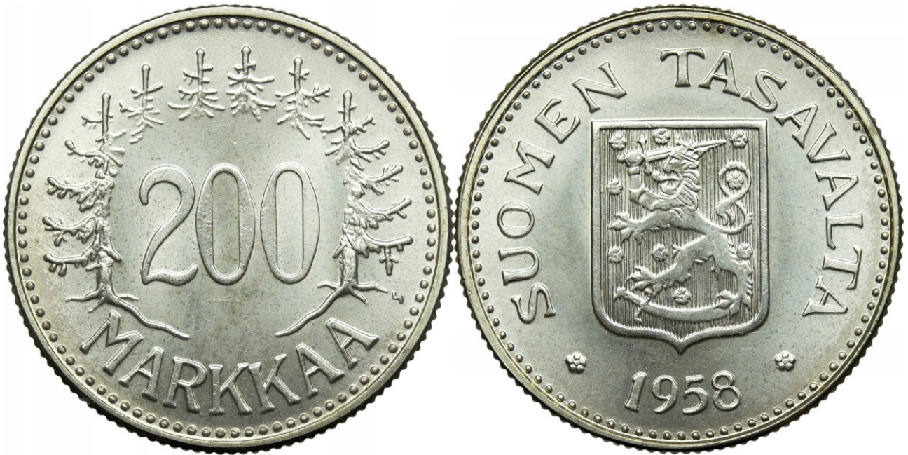
Kuva 3. 200 markkaa 1958, mukaellulla rahapajan johtajan kirjaimella H, josta on siis tehty kirjainta S muistuttava.

Lähempi vertailu osoittaa, miten mukaelma on tehty.