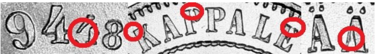
Kuva 3. 1 markka 1915 tunnuspuolen kehäkirjoituksessa ilmeneviä meistin kulumisesta/täyttymisestä johtuvia vajauksia numerossa 4 ja kirjaimissa K, P, E ja Ä.

Koska rahaa lyötiin suuri määrä, tarvittiin runsaasti meistejä. Vaikka käytössä olikin moderni meistien kaiverruskone, näkyi meistien suuri tarve pieninä heittoina yksityiskohdissa, kuten kuvan 2 kirjaimen S ”vaelteluna”. Koska meistit ajettiin ilmeisen loppuun, esiintyy erityisesti tunnuspuolella pieniä meistihalkeamia ja kirjainten täyttymisiä.