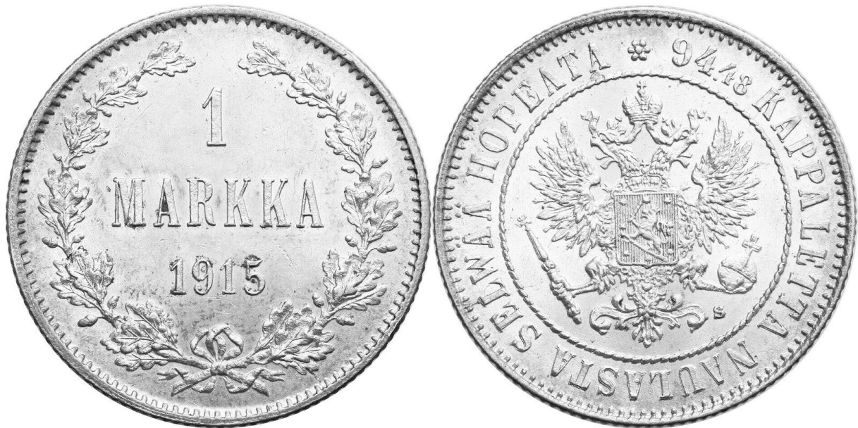
Kuva 4. 1 markka 1915 erityisesti tunnuspuolen sanan NAULASTA kaksoiskaiverrusvariantti. Kuvien muokkaus ja yhdistely Jorma J. Impola, SeAMK.