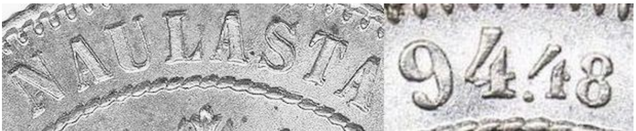
Kuva 5. 1 markka 1915 tunnuspuolen kehäkirjoituksessa erityisesti sanassa NAULASTA esiintyvä kaksoiskaiverrusvariantti. Tämä variantti esiintyy kuvan kaltaisen selkeästi vain meistin kulumisesta/täyttymisestä johtuvan pienemmän numeron 4 vajauksen eli puuttuvan vaakaviivan yhteydessä. Huomatkaa myös ensimmäisen 4:sen korjailtu vaakaviiva. Kuvien muokkaus ja yhdistely Jorma J. Impola, SeAMK.

Omien havaintojeni mukaan tämä sanan NAULASTA kaksoiskaiverrusvariantti kuvan 5 kaltaisen selkeänä on varsin harvinainen, kun taas vajaita/täyttyneitä kirjaimia esiintyy hyvin yleisesti. Voisi melkein sanoa, että 1 markan hopearaha vuodelta 1915 täysin ehjin tunnuspuolen kirjaimin ilman edes osittaisia kaksoiskaiverruksia on se kaikkein harvinaisin ja vaikein versio löytää.