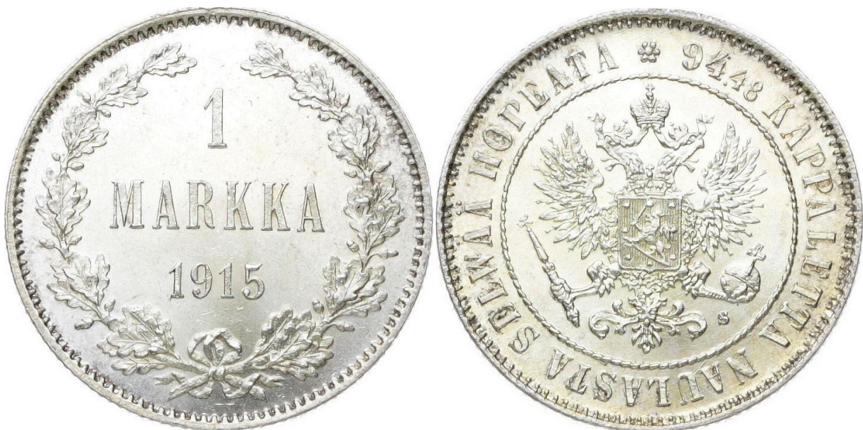
Kuva 1. 1 markka 1915. Kuvien muokkaus ja yhdistely Jorma J. Imppola, SeAMK.

Yhden markan hopearahoja vuodelta 1915 on pidetty ehkä tylsinä keräilykohteina, koska niitä liikkuu keräilymarkkinoilla hyvin runsaasti, koska niitä lyötiin varsin suuri määrä (1 212 000 kappaletta, mikä tekee siitä kolmanneksi eniten lyödyn autonomian ajan hopeamarkan vuosien 1865 ja 1866 jälkeen) ja siitä, että se viimeisenä lyöntivuotena ”kohtasi” ensimmäisen maailmansodan aiheuttaman inflaation päätyen suurissa määrin ihmisten kätköihin.