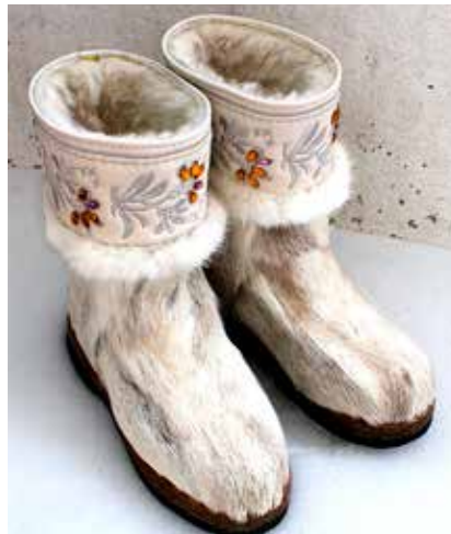
Helmin koristellut kengät.

Taljat rahaksi -hanke järjesti talvella 2023 Sallan viimeisessä teurastuksessa työpajan, jossa kolmen paikalle saapuneen teurastamon edustajat tapasivat Reindeer Boot Shopin omistajia ja kokeilivat koipinahkojen talteenottoon liittyviä työvaihteita. Yksi työpajaan osallistuneista teurastamoista toimitti koe-erän koipia Mongoliaan vielä samana keväänä. Myös kahdella muulla teurastamolla ollaan toiveikkaita saada koipinahkojen talteenotto alkamaan tulevalla teuraskaudella. Onko juuri sinun teurastamosi seuraava, joka ottaa askeleet porosaappaiden maailmaan?