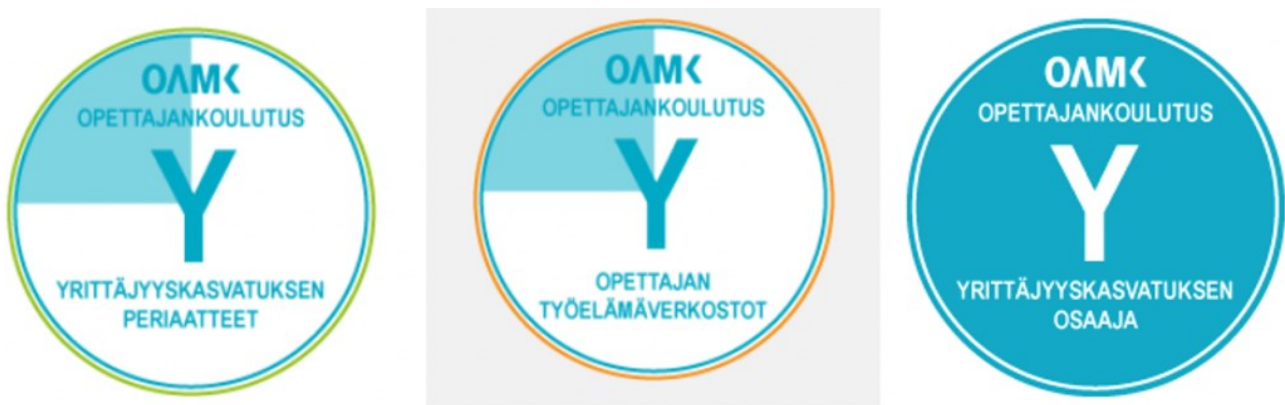
KUVA 1. Yrittäjyyskasvatuksen pakolliset osaamismerkki ja Yrittäjyyskasvatuksen osaaaja -merkki (Oamk, Amok, eMateriaalit).

Open Badges eli digitaaliset osaamismerkki ovat sähköisiä todisteita osaamisesta. Ne sisältävät osaamistavoitteita, arviointikriteerejä ja osaamisen osoittamisen tapoja. Osaamismerkkien avulla voidaan tunnistaa ja tunnustaa osaamista, taitoja ja saavutuksia, joita kartutetaan opiskelujen yhteydessä, työssä, harrastuksissa ja niin edelleen. Yksittäisistä osaamismerkeistä voidaan myös koota kokonaisuuksia esimerkiksi osaamisalueiden ja osaamisen tason mukaan. Yksittäisten merkkien suorittaja voi saada myös lopuksi tasomerkkin. (Kuva 1.) [11]