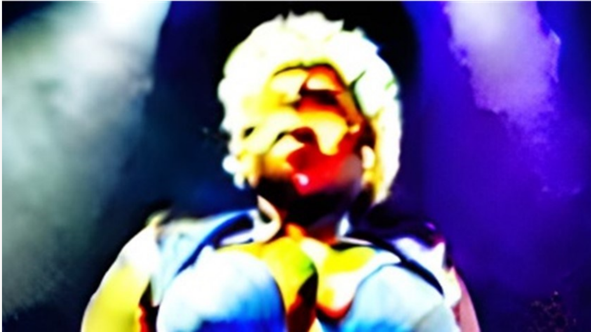
Kuva 7. Mitä lapsi sanoisi Arja-tädille aidossa suorassa kontaktissa? Mitä Arja-täti vastaisi siihen?

Skype-, Teams- ja Zoom-aikana olemme tottuneet suoraan videokontaktiin. Se ei enää ole sci-fiä eikä kummallista. Oma kuvamme on saattanut roikkua muiden näytöillä tuntitolkulla erilaisia kokoontumisissa. Olemme antautuneet rajatulle videovalvonnalle. Striimillä voi kuitenkin olla satoja tai tuhansia katsojia. Kaikki eivät voi päästä PIP-kuvaruutuihin tai saada ääntään kuuluville. Esiintyvän tahon on valittava interaktioista ne, jotka hän haluaa päästää sisään.