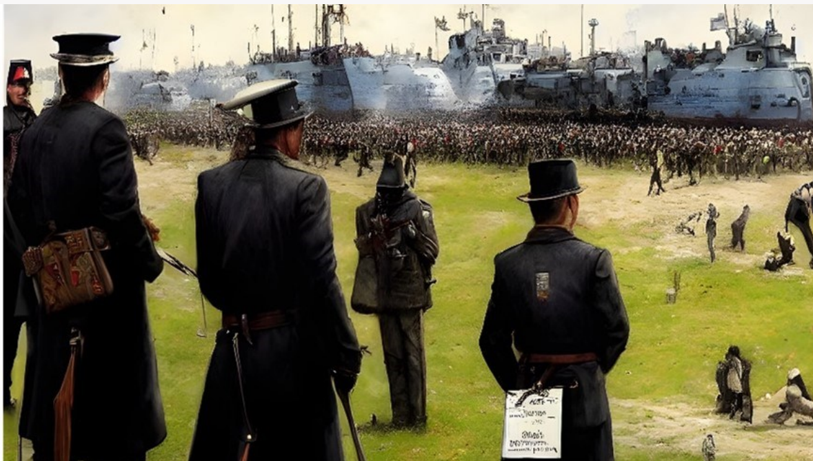
Kuva 8. Katsojat voisivat lyöttäytyä yhteen ja muuttaa kollektiivisesti tarinan suuntaa.

Katsojat voisivat pisteyttää striimissä tehtyjä dramaturgisia ratkaisuja ja ohjata esitystä haluamaansa suuntaan, kohti onnea tai traagista lopputulemaa. Katsojat voisivat myös reagoida kollektiivisesti. Jos vaikka kyseessä on Hamlet ja kaikille on selvää, että kaikki henkilöt kuolevat eikä sitä voida välttää, katsojat voisivat yhdessä yrittää rakentaa esteitä kuolemalle tarinan kuljetusta muokaten ja pitää henkilöt elossa mahdollisimman pitkään. Näin katsojat voisivat tukea toisiaan rakentamalla toistensa ideoiden päälle uusia ehdotuksia ilman, että esityksen lopulliset päämäärät kuitenkaan epäonnistusivat.