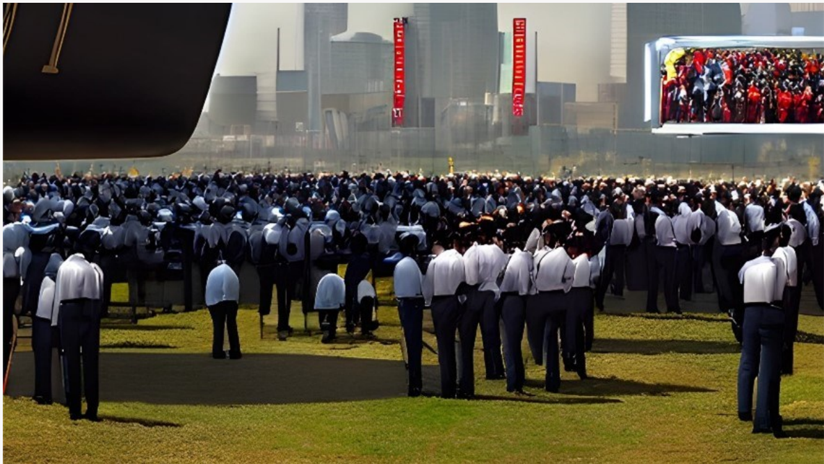
Kuva 9. Anonyymien yleisön joukossa voi piillä kuka tahansa.

Kaikessa inhimillisessä vuorovaikutuksessa on kyse luottamuksesta ja riskinotosta. Vastapuoli voi aina olla pahantahtoinen, sairas, välinpitämätön, inhottava, päihtynyt, väkivaltainen, tai hänellä voi olla jokin valmis asenne, johon hän peilaa kaikkia vuorovaikutustilanteitaan. Esitys elävän yleisön edessä on aina alttiina huutelulle, kesken poistumisille, meluamiselle, huonolle käytökselle, yksityisille asioille ja joskus jopa väkivallalle.