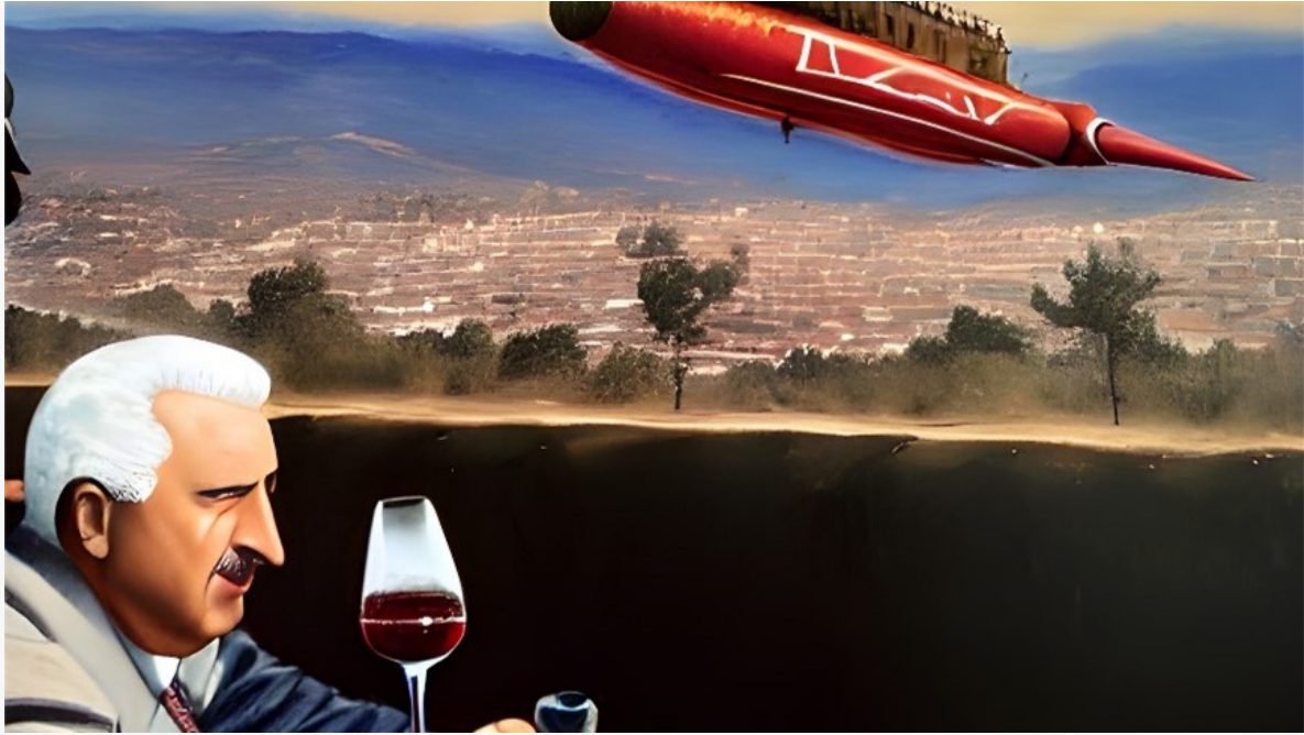
Kuva 3 Striimin passiivista katsojaa on vaikeampi hallita kuin salissa istuvaa yleisöä.

Yksin ruudun ääressä striimiä katsova saattaa kaivata yhteisöllisyyttä muiden katsojien kanssa. Tässä häntä voisi auttaa vertaistukea antava, ruudulla esiintyvä kanssakatsoja. Tällainen reagoiva esikatsoja voisi ilmaista tuntemuksiaan esityksen suhteen, nauraa ja liikuttua striimin katsojan nähden. Esikatsoja voisi hiljaa kuiskaten kommentoidakin näkemäänsä. Tällainen esikatsoja voisi istua joko aivan muualla, ruudun ääressä hänkin tai yleisön joukossa, ja hänen reaktionsa voisivat olla etukäteen suunniteltuja ja ajoitettuja. Tällainen esikatsoja voi olla esitystaiteen ammattimainen some-vaikuttaja, jonka reaktiot ja mielipiteet kiinnostaisivat tai huvittaisivat striimin katsojaa.