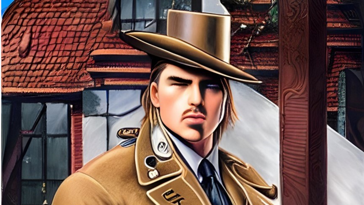
Kuva 6. Entä jos esiintyjä tuijottaisi katsojaa oikeasti suoraan silmiin?

esiintyjät lähelle katsojia. Suosituimmat TV-esiintyjät tuntuvat puhuvan suoraan katsojalle, ihmiseltä ihmiselle.