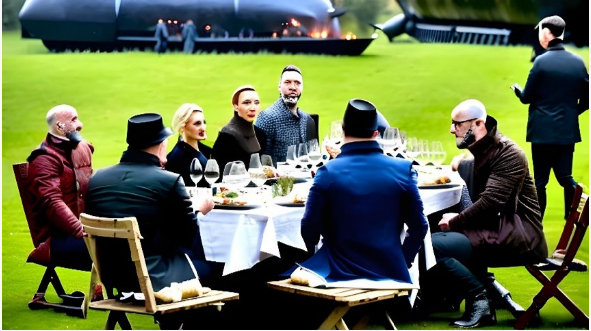
Kuva 1. Striimin katsoja istuu samassa pöydässä, tai tirkistelee samanaikaisesti muiden kanssa simultaania elävää tilannetta.

Hyvästä striimistä innostuu aktiivinen ja osallistuva fanijoukko, joka kaipaa tapahtumalta ainutkertaisuutta, samanaikaisuutta, ennalta arvaamattomuutta ja huomioivuutta. Striimin etuna on välittömyys, hetkellisyys ja osallistavuus. Striimin lisäarvo on pelillisuus, interaktiivisuus, läsnäolo, ennakkoluulottomuus, pelottomuus ja suoruus. Striimiin pitäisi voida mennä kuin teatteriin, vaikka katsoja ei liikahtaisikaan kotisohvalta. Striimi vertautuu huolellisuudessaan tallenteeseen ja jää siinä teknisesti toiseksi. Siksi striimissä on oltava jotain ainutkertaista, jonka voi kokea ainoastaan suorassa lähetyksessä.