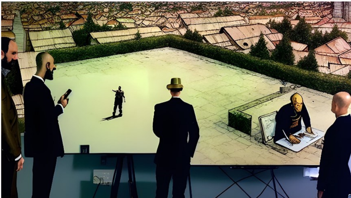
Kuva 5. Entä jos katsojat saisivatkin vaikuttaa striimiin?

Entä jos olisikin toisin? Entä jos katsoja voisikin suoraan vastata esiintyjän katseeseen? Entä jos esiintyjä näkisi suoraa kuvaa katsojastaan ja he voisivat tuijottaa toisiaan? Näinhän usein tapahtuukin, kun uutislähetyksessä toimittaja tai uutisankkuri kysyy kysymyksen suoraan kameralle ja kotioiloissa asiantuntija lausuu tietokoneensa ääressä suoraan omalle kameralleen vastauksen. Katsekontakti ilmaistaan kutakuinkin suoraan huomiopisteeseen leikkautuvaan kuvitteelliseen vastakuvaan, silmät ovat kuvan rajauksessa kutakuinkin samoilla kohdilla. Joskus käytetään myös kuvaa kuvan sisällä (PIP).