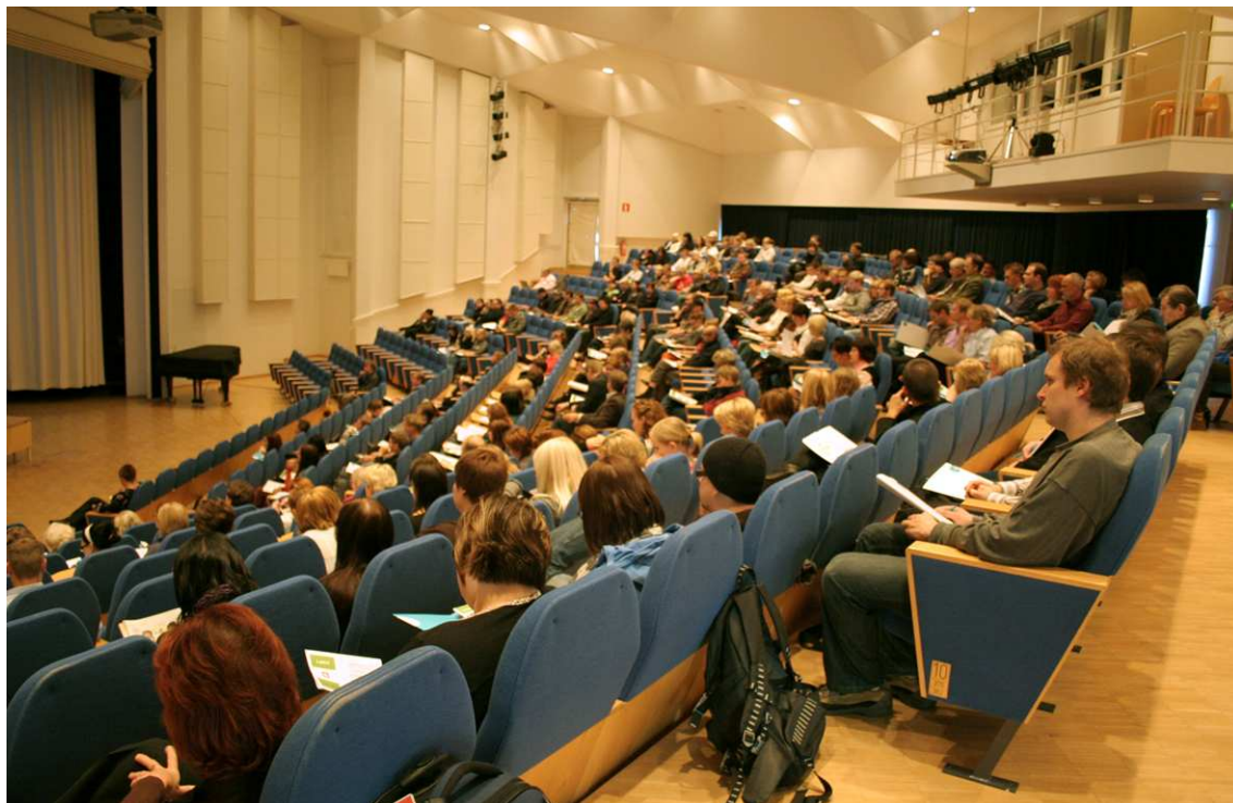
Kuvio 1: Risto Ryti –sali oli täynnä sosiaalisesta mediasta kiinnostuneita kuulijoita

Seminaariin ilmoittautui ennakkoon n. 130 henkilöä, mutta Risto Ryti –sali täyttyi yli odotusten. Osallistujalistaan nimensä kirjasi 180 henkilöä, mutta kaiken kaikkiaan paikalla oli lähes 300 osallistujaa.