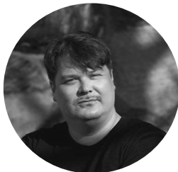
VÄITÖSKIRJATUTKIJA HELSINGIN YLIOPISTO