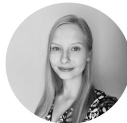
TUTKIMUSAVUSTAJA HELSINGIN YLIOPISTO