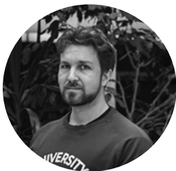
YLIOPISTOTUTKIJA HELSINGIN YLIOPISTO