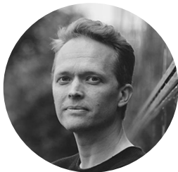
PSYKOLOGIAN PROFESSORI HELSINGIN YLIOPISTO