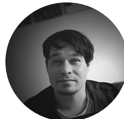
VIESTINNÄN ASiantuntija HAAGA-HELIA AMMATTIKORKEAKOULU