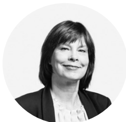
YLIOPETTAJA HAAGA-HELIA AMMATTIKORKEAKOULU