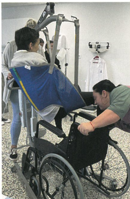
MiCare-kouluttajien koulutusta Malagassa.

Tuen tarpeisiin vastaa kansainvälisessä MiCare-hankkeessa kehitetty intensiivikurssi, jolla tutustutaan hoito-