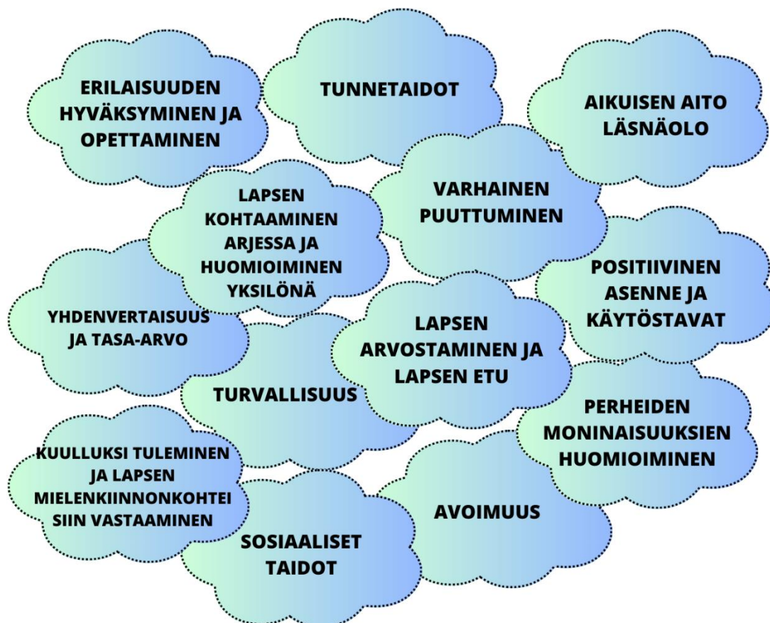
Kuvio 1. Huoltajien korostamat arvot varhaiskasvatuksessa (Humppilan kunta, 2022).

sujuisi arjessa järjestelmällisesti sekä ennaltaehkäisevästi. Vaikka varhaiskasvatussuunnitelma velvoittaa lasten tasa-arvoiseen kohteluun, tuo uusi tasa-arvosuunnitelma silti uutta ja kaivattua näkökulmaa lasten kanssa työskentelyyn. Humppilan kunta on asukasluvultaan pieni, joten varhaiskasvatuksen asiakkaat koostuvat pitkälti kantaväestöstä. Tämän vuoksi Humppilan kunnan varhaiskasvatuksessa etnisen tasa-arvon toteutumisen tarve on jäänyt vähemmälle.