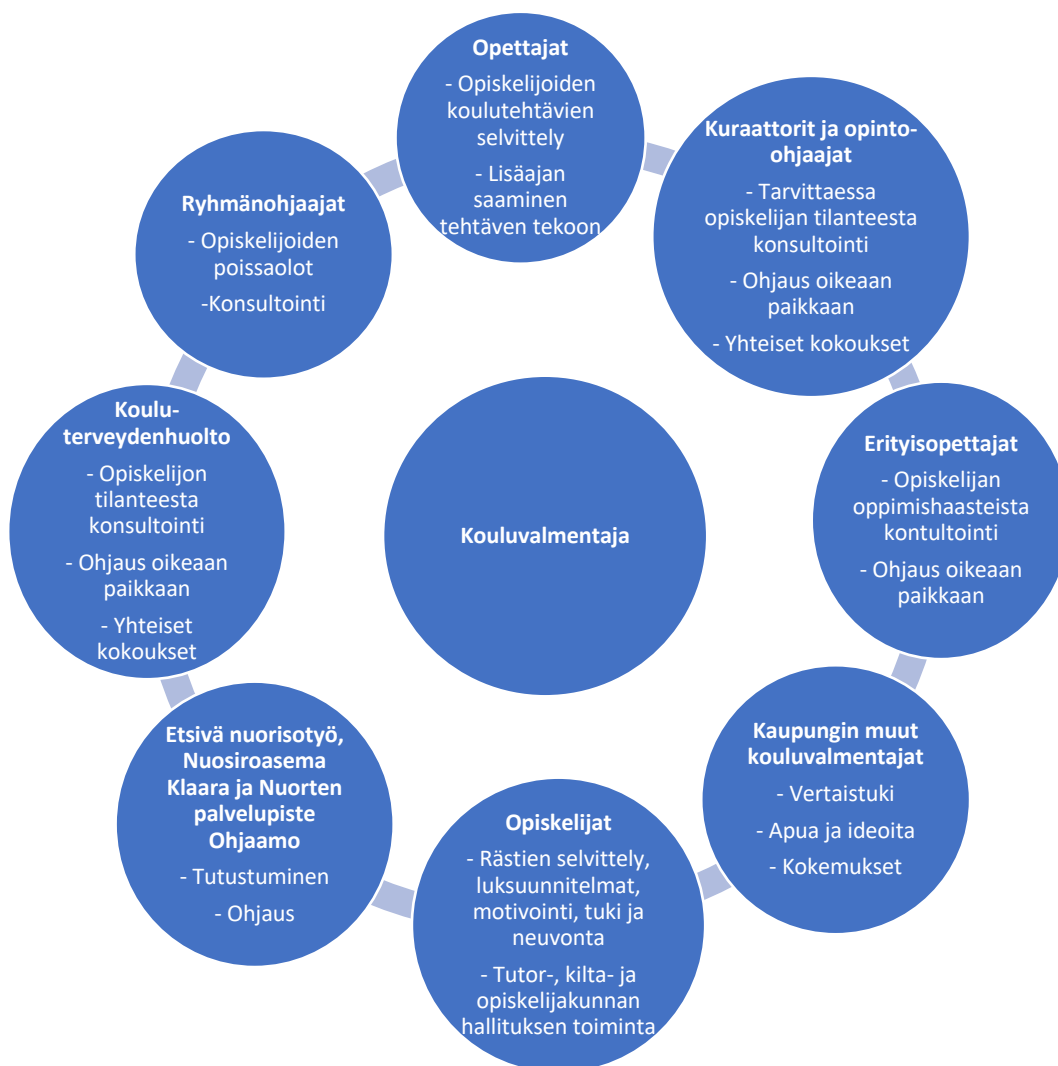
Kuvio 2. Kouluvalmentajan yhteistyötahot.