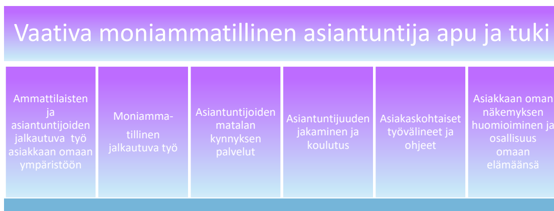
KUVIO 4. Vaativa moniammatillinen asiantuntija apu ja tuki