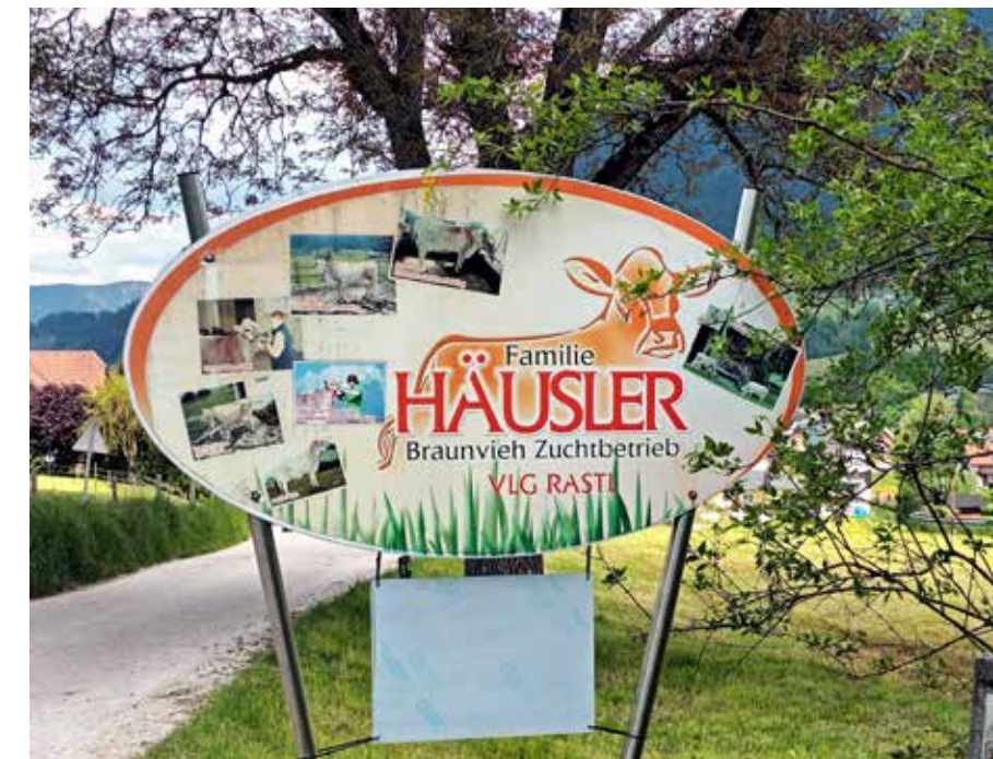
Tilan kyltti kertoo, millaisia eläimiä tilalta löytyy.

"Kovasta ottavat leipänsä maatalousyrittäjät Itävallassakin."