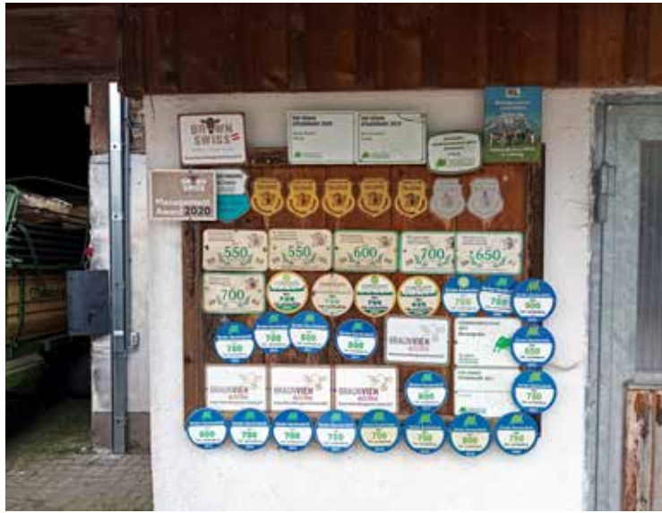
Sekä tila että karja on saanut useita palkintoja.