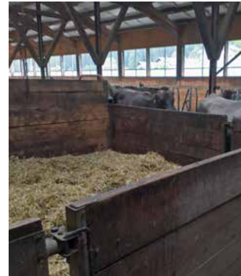
Puurakenteita itävaltalaisella robottitilalla, tässä poikimakarsina.