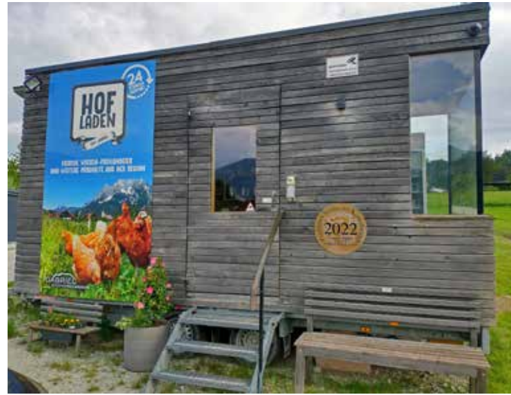
Yksi Lantschernin kylän tilapuodeista.