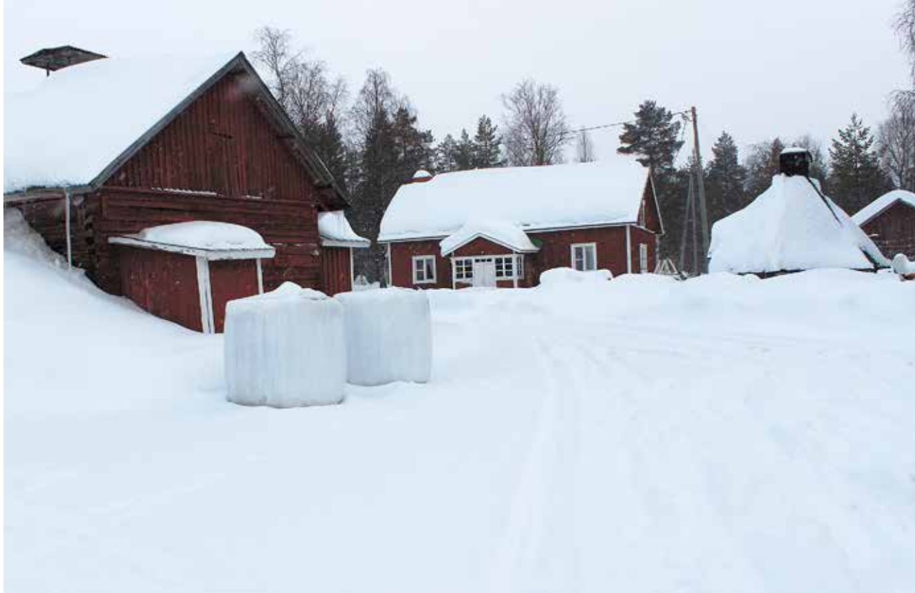
Tilan rakennuksia kannattaa hyödyntää matkailutuotteita kehittäessä. Kuva Tapio Saukon porotilalta.