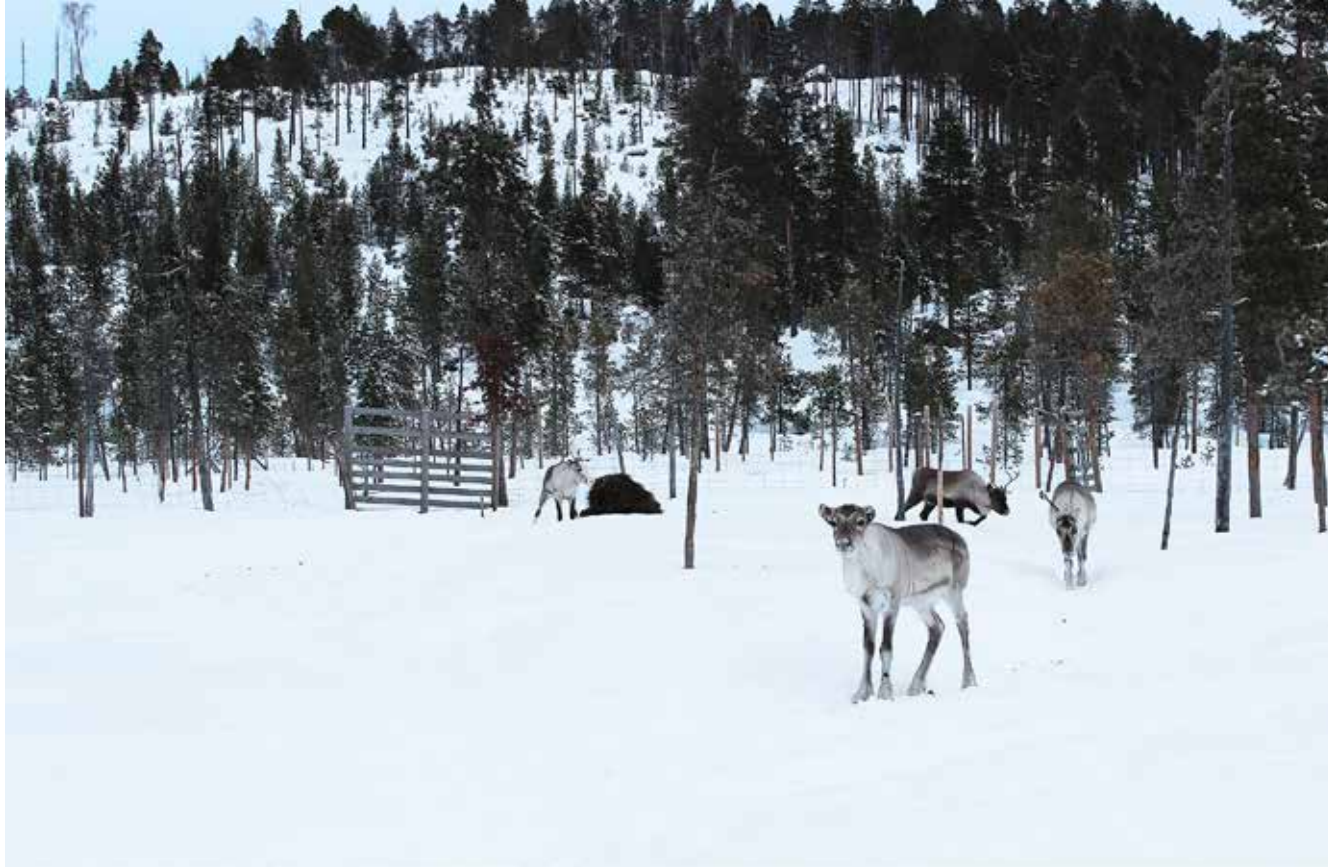
Porojen rauhallinen kohtaaminen yhdistettynä ympäröivään luontoon täyttää monen matkailijan toiveet. Kuvassa Porotila Renninän maisemia.

markkinointi sekä hinnoittelu. Työpajojen teemat olivat nousseet esille poro- ja kotieläintilallisille tehdyn kyselyn sekä hankkeen toimenpiteisiin osallistuneiden tilojen kartoituksen pohjalta.