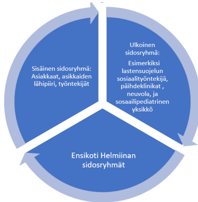
Kuva 1: Ensikoti Helmiinan sidosryhmät

Ensikoti Helmiinan ulkoisiin sidosryhmiin kuuluvat yhteistyötahot, joiden kanssa työssä olemme tekemisissä, esimerkiksi lastensuojelun sosiaalityöntekijät, päihdeklินิกoiden työntekijät, sekä mielenterveydellisten haasteiden tapauksessa mielenterveyden hoidon ammattilaiset. Asiakkaalla saattaa olla myös omia kontakteja esimerkiksi Kelaan. Asiakkailla saattaa olla tapaamisia HUS: n sosiaalipediatriisessa yksikössä, jossa seurataan lapsen vointia ja kehitystä. Ulkoisiin sidosryhmiin kuuluvat myös neuvola ja synnytyssairaalat.