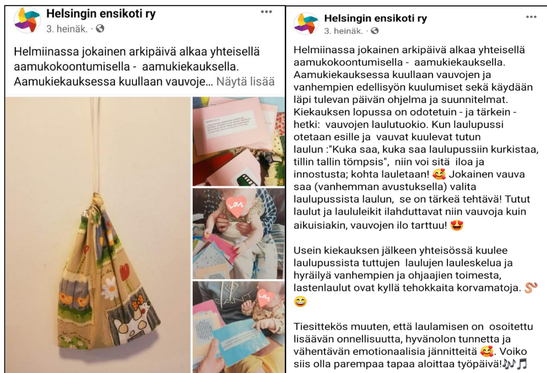
Kuva 4: Facebook-päivitys 3.7.2023

Maanantai alkoi tuttuun tapaan Aamukiekauksella ja tavoitteiden asettamisella. Aamukiekauksen päätteeksi osallistimme vauvat mukaan aamuhetkeen, laulupussia käyttäen. Työpäivään sisältyi myös lääkkeiden jakoa, kirjauksia asiakastietojärjestelmään, raportointia, ja yhteisössä auttamista. Päivään kuului myös yhteydenottoja yhteistyötahoille.