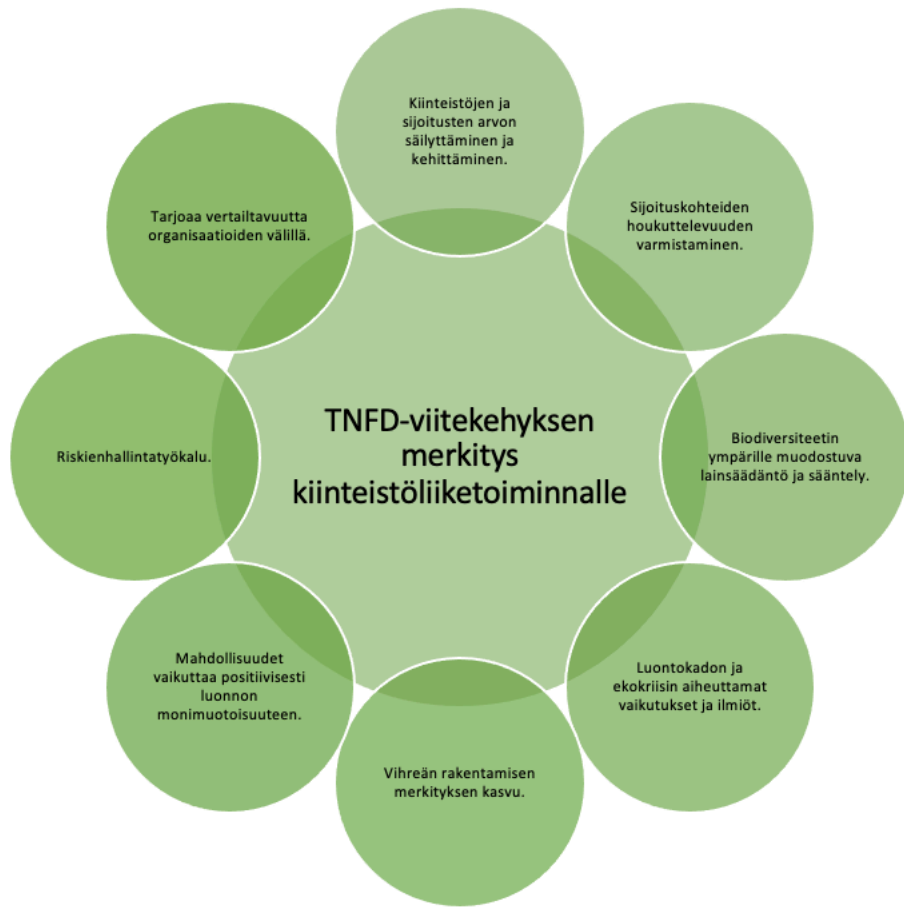
Kuvio 2: Yhteenvedo TNFD-viitekehyksen merkityksestä liiketoiminnalle asiantuntijahaastatteluiden mukaan.

Kuviossa 2 on teemoiteltu asiantuntijahaastatteluissa esiin nousseet seikat, jotka kertovat TNFD-viitekehyksen merkityksestä kiinteistöliiketoiminnalle. Kuvion muodostamisessa on yhdistetty samaan teemaan viittaavia lausuntoja, eikä niitä ole esitetty kuviossa välttämättä siinä sanamuodossa, jolla haastateltavat ovat ne esittäneet.