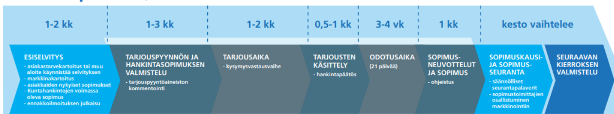
Kuvio 3 Julkisten hankintojen hankintaprosessi, Kuntahankinnat

Hankintaprosessi voidaan ajatella systemaattiseksi tavaksi lähestyä toimittajamarkkinoita. Prosessi tähtää siihen, että tilaaja saa prosessin päätteeksi valittua itselleen parhaimman ja soveltuvimman toimittajan tai toimittajat tilattavien tuotteiden tai palveluiden osalta. (Logistiikan maailma 2023.) Yksityisen sektorin hankintaprosessi on samanlainen kuin julkisen toimijan hankintaprosessi, mutta julkisen toimijan hankintaprosessia säätelee hankintalaki.