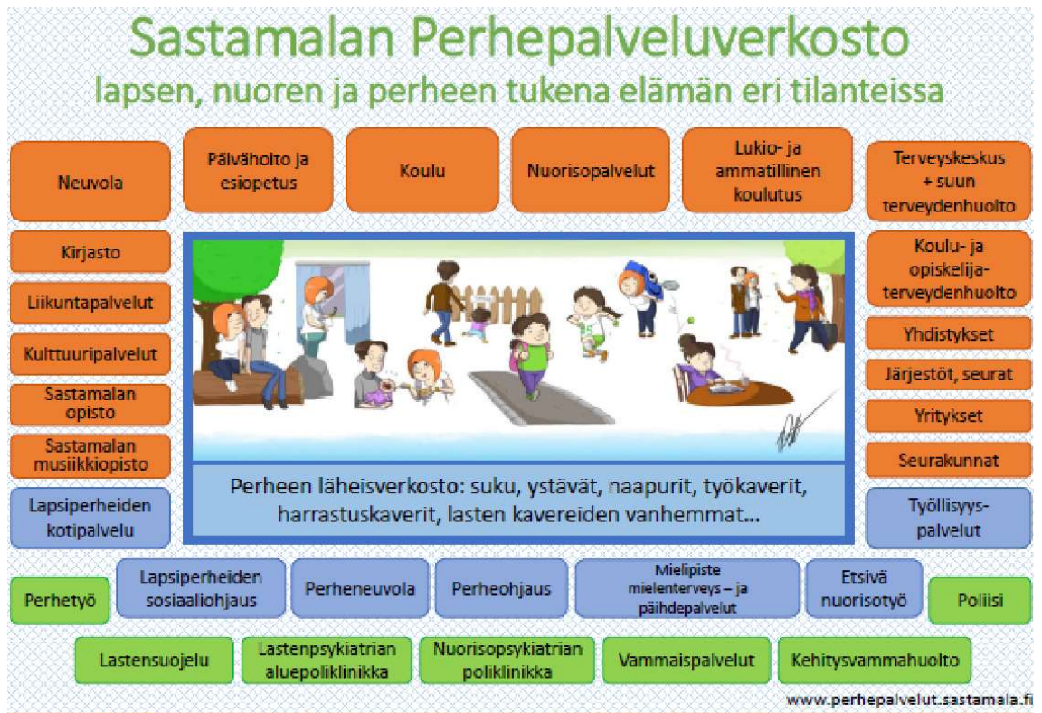
KUVA 2. Sastamalan perhepalveluverkosto.

Perhepalveluverkoston ohjausryhmän aloitteesta ja päätöksellä Sastamala on mukana PirSOTEn systeemisen toimintamallin näkökulman ja periaatteiden levittämisen hankkeessa. Perhepalveluverkoston toimijoista systeemisen toimintamallin kehittäjätiimissä ovat mukana varhaiskasvatus, perusopetus, toisen asteen koulutus, opiskeluhuolto, neuvola, perhetyö ja lastensuojelu. Varhaiskasvatus tekee monialaista yhteistyötä tarvittaessa lähes jokaisen perhepalveluverkoston toimijan kanssa. (Sastamalan perhepalveluverkosto 2022.)