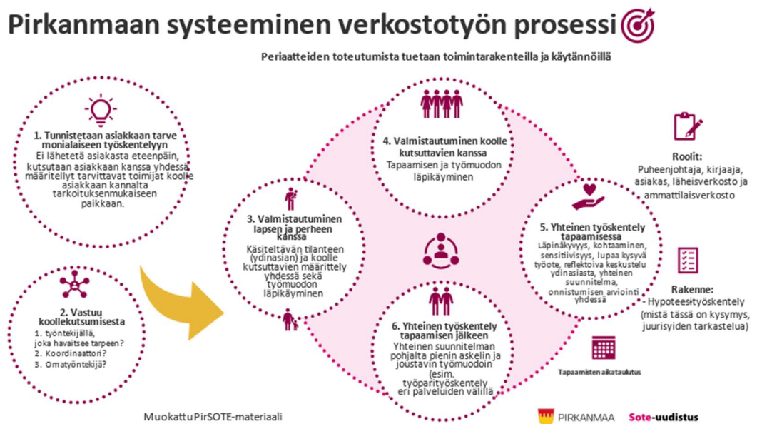
KUVA 4. Mukailten Pirkanmaan systeeminen verkostotyön prosessia. (PirSOTE)

Työpajojen kolmannessa vaiheessa harjoiteltiin systeemisen verkostotyön prosessia case-työskentelyn avulla. Kuvasta 4 löytyy systeemisen verkostotyön prosessi, jonka avulla harjoittelimme verkostopalaveria työpajoissa kuvitteellisen casen avulla. Kuva auttaa jäsentämään prosessia ja tuo esille elementtejä, jotka kuuluvat systeemiseen toimintamalliin.