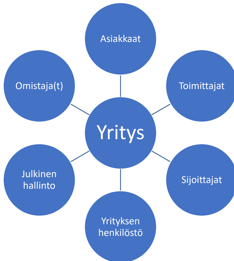
Kuvio 1. Sidosryhmät (mukaillen Tomperi 2021)

Sidosryhmät yritykselle ovat toimijat, jotka osallistuvat jollakin tavalla yrityksen toimintaan. Keskeisimpinä sidosryhminä ovat omistajien lisäksi julkinen hallinto, asiakkaat, sijoittajat, tavarantoimittajat sekä yrityksen henkilöstö (Kuvio 1).