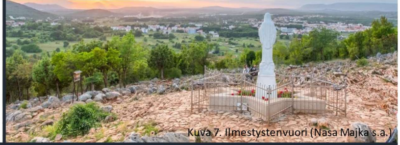
Kuva 7. Ilmestystenvuori (Nasa Majka s.a.)