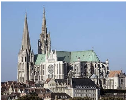
Kuva 11. Chartresin katedraali