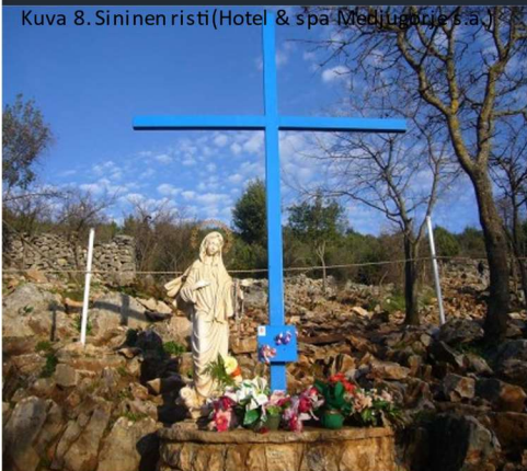
Kuva 8. Sininen risti (Hotel & spa Medjugorje s.a.)