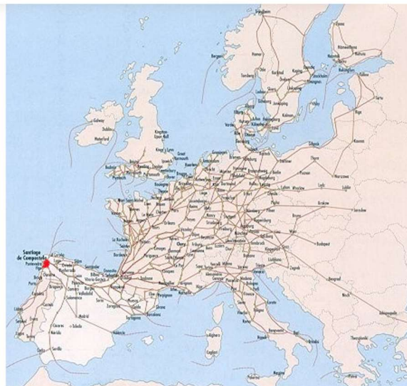
Kuva 9. Camino de Santiagon pyhiinvaellusreitistö (Lepelerin.info s.a.)