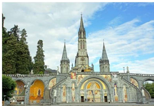
Kuva 3. Lourdes Basilica (SpottingHistory s.a.)