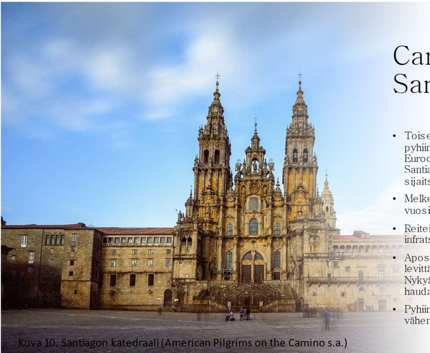
Kuva 10. Santiagon katedraali (American Pilgrims on the Camino s.a.)