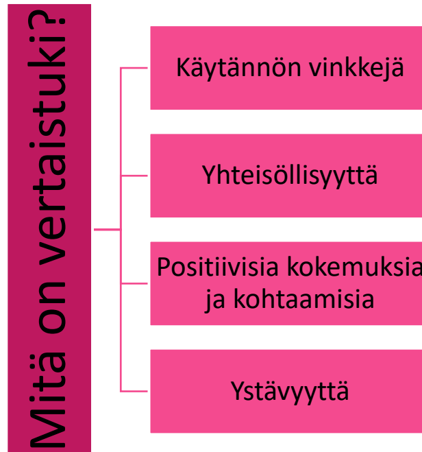
Kuvio 2: Haastattelun vastauksia.

Opinnäytetyön tulokset, eli edellä mainitut teemat ja niihin liittyvä asia nostettiin esiin lähes jokaisessa haastattelussa. Näin ollen haastattelujen pohjalta saatu tieto vertaistuen merkityksestä vastasi odotuksia ja hankittu teoriatieto tukee näitä havaintoja.