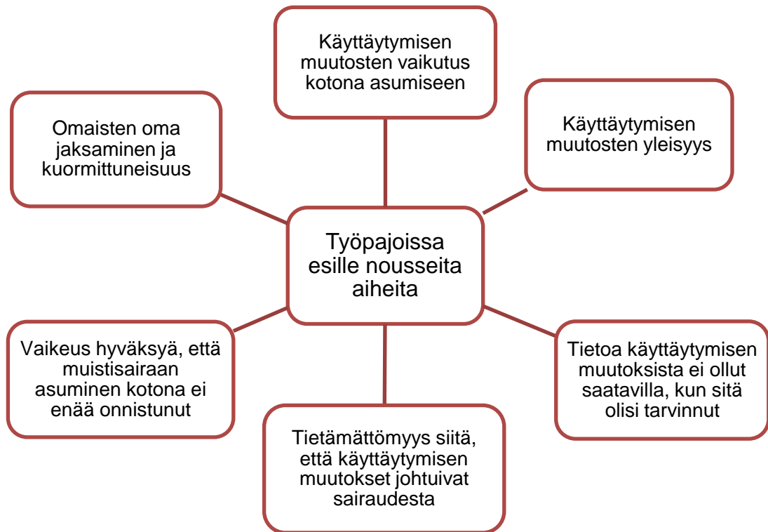
Kuvio 2. Työpajoissa esille nousseita aiheita

Puolison muistisairausdiagnoosi oli tullut monille työpajan osallistujalle shokkina. Omaiset kertoivat, että olivat kaivanneet puolison sairastuessa enemmän tietoa muistisairauden etenemisestä, oireista sekä erilaisista käyttäytymisen muutoksista. Monet omaiset kokivat, ettei tietoa ollut saanut silloin kun sitä tarvitsi. Työpajojen osallistujat kokivat kuitenkin tärkeäksi sen, että pystyivät nyt osallistuessaan työpajoihin auttamaan tulevaisuudessa samassa tilanteessa olevia omaisia.