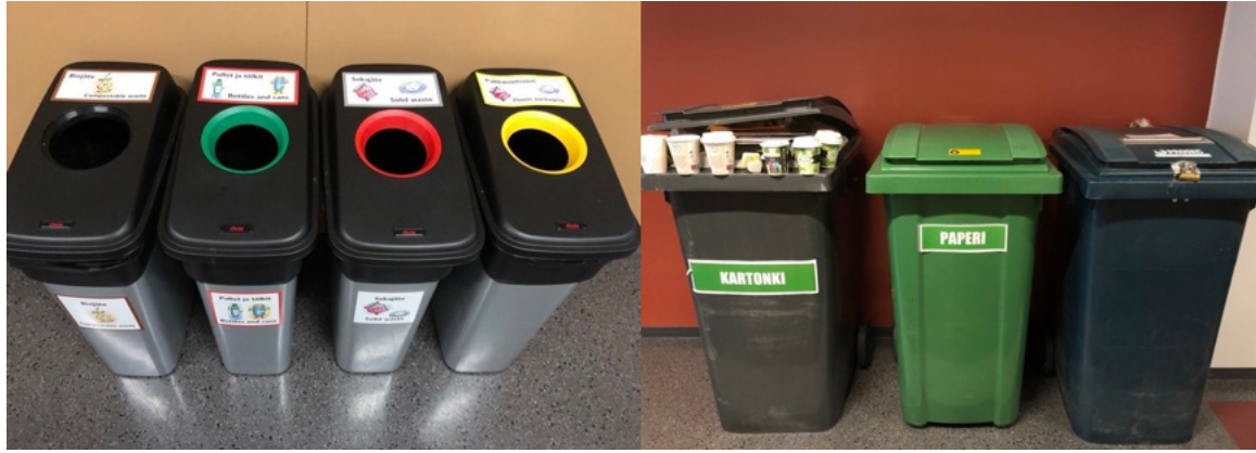
Kuva 2. Tamkin uudet lajitteluroskikset: jakeet biojäte, pullot ja tölkit, sekajäte ja kuluttajapakkausmuovi ja isot vihreät: kartonki (johon kertakäyttökahvikupitkin!), normaali paperinkeräys ja lukollinen tuhottavia papereita varten (Kuvat T. Wickman-Viitala)

Uusista jakeista puuttuu kertakäyttökahvikupeille sopiva jae, sillä kartonkia kerätään käytävillä oleviin isompiin 240 litran astioihin. Astiat ovat samassa yhteydessä keräyspaperiastioiden kanssa. Näihin isoihin kartonkiastioihin päätyy myös ihan oikein lajiteltuja kertakäyttökuppeja! Mutta RUOKO-hankeen tiimiläiset havaitsivat syksyllä, että kuppeja ja muita jakeita oli uusissa roskiksissa iloisesti sekaisin! Hanke päätti tehdä lajittelua konkreettisesti näkyväksi Tamk konferenssipäivässä, tavoitteena edistää ja motivoida henkilöstön osallisuuden lisääntymistä ja lajitteluajatteluun havahduttamista. Tieto kertakäyttöisten kahvikuppien lajittelusta ja niiden määrästä päivittäisessä, viikoittaisessa ja kuukausittaisessa kulutuksessa tulee monelle yllätyksenä (n.17500 kpl kuukaudessa, CampusRavita). RUOKO-hankkeen yhteistyökumppani DSSmith lahjoitti konferenssipäivän tilaisuuteen 10 lajittelutornia kartonkisia kertakäyttökuppeja varten. Kun "kertakäyttökuppivuoret" visualisoidaan, kahvin ostaja todennäköisesti haluaa lajitella jatkossa oikein ja edistää elinpiirissään muitakin kestäviä ja ekologisia tekoja ja valintoja.