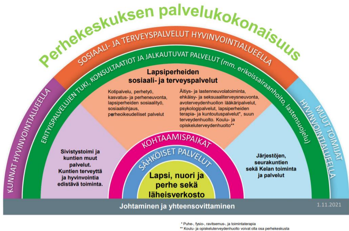
Kuvio 1. Perhekeskuksen palvelukokonaisuus (Terveiden ja hyvinvoinnin laitos 2022a)

Oheisesta kuviosta (kuvio 1.) voi hahmottaa, kuinka perhekeskusten palvelukokonaisuus rakentuu. Toiminnan ytimessä on lapsi tai nuori, sekä hänen perheensä ja läheisverkkonsa. Ensimmäinen porras perhekeskuksiin on sähköiset palvelut, jotka ovat helposti kaikkien saatavilla ja joista ammattilaiset osaavat tarvittaessa ohjata perheen eteenpäin perhekeskusten palveluihin. Perhekeskusten kohtaamispaikat (ks. luku 3.2) ovat kaikille perheille avointa matalan kynnyksen toimintaa. Näiden toimintojen jälkeen palvelut asetuvat eri sektoreittain niitä tarvitseville. Nämä kuviossa suurimmaksi osuudeksi kuvatut palvelut ovat peruspalveluita ja niitä tarjotaan lapsille, nuorille ja perheille heidän yksilöllisten tarpeidensa mukaisesti. Ylimpänä palvelumuotona kuviossa on vielä erityispalvelut, jotka eivät asetu kolmen isoimman sektorin palveluvalikoimaan. Erityispalveluita on esimerkiksi lastensuojelun mukainen työ, jota tarjotaan ainoastaan sitä tarvitseville perheille. Perhekeskuspalvelut on tarkoitettu helposti yhteensovitettavaksi, jolloin asiakas saa eheän ja mahdollisimman paljon omia tarpeitaan vastaavan palvelukokonaisuuden (Hastrup ym. 2021: 21). Kuvion ylin kaari kuvaa palveluiden tuottajia, joita ovat kunnat, sosiaali- ja terveyspalvelut sekä hyvinvointialueiden muut toimijat.