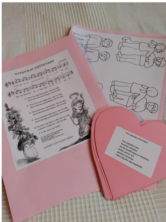
Kuva 2. Laulu- ja lorukorttien ulkoasu

Kokosin ideakansion loppuun kirjavinkki- ja materiaalisivun, jossa tiivistin hyödyllisiksi kokemieni, kaveritaitoja ja musiikkikasvatusta käsittelevien teosten sisältöä. Erillisenä materiaalina askartelin ideakansion ideoiden pohjalta laulu- ja lorukortteja, joita voi hyödyntää tuokioissa lasten kanssa. Kuvassa 2 näkyy laulu- ja lorukorttien ulkoasu. Kortteihin keräsin nuotillisia kaveruuteen, ystävyteen ja tunteisiin liittyviä lauluja, laululeikkejä ja loruja laulukirjoista.