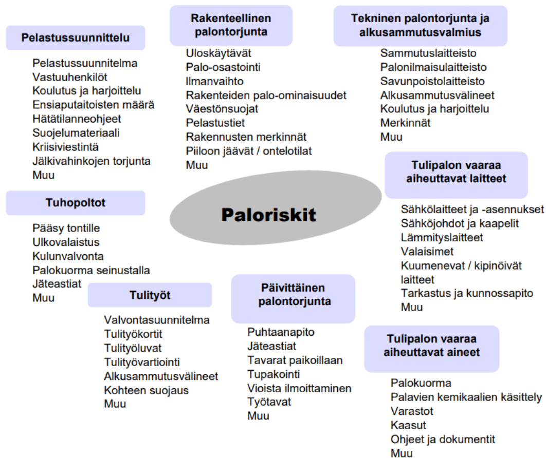
Kuva 6. Paloriskikartta (Suomen riskienhallintayhdistys, Paloriskit -tietokortti 2022.)