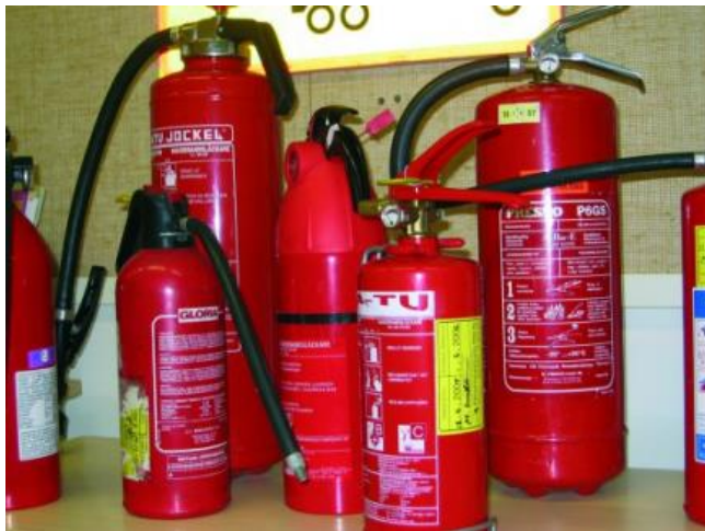
Kuva 3. Erinäisiä käsisammuttimia (Majamaa 2018, 96.)

tarkastusväli. Tarkastukset pitää teettää turvallisuus- ja kemikaaliviraston rekisteröimissä huoltoliikkeissä. (Majamaa 2018, 97.)