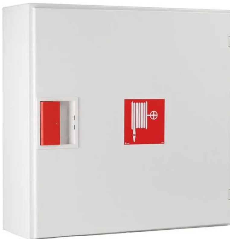
Kuva 4. Pikapalopostikaappi (Presto 2022.)