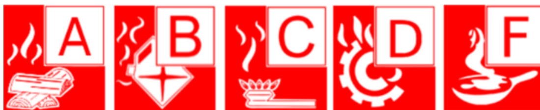
Kuva 1. Sammuttimien soveltuvuusluokkaetiketit sammuttimien kyljessä (HIKLU 2020 4.)