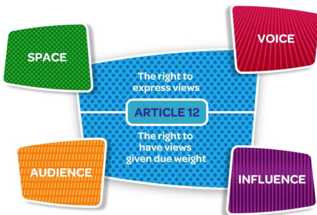
Kuvio 2. Laura Lundy malli lapsen osallisuudesta (Council of Europe, 2022).

Lundy-malli perustuu neljään eri elementtiin, jotka ovat tila (space), ääni (voice), yleisö (audience) ja vaikuttaminen (influence). Lundy on todennut, että pelkäänsä lapsen ääni ei riitä vaan heillä pitää olla lisäksi tila, jossa heidän äänensä tuodaan kuuluviin, yleisö, jolle heidän mielipiteensä ja näkemyksensä kerrotaan sekä vaikuttaminen eli mielipiteiden kuuleminen ja huomioon ottaminen. (Council of Europe, 2022.)