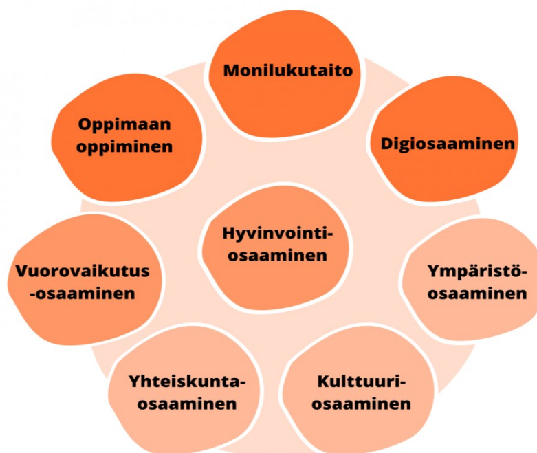
Kaavio 1. Laaja-alainen osaaminen TUVA:ssa. (Opetushallitus, 2023)

Opiskelusuunnitelman suunnittelemisessa opiskelija oppii tunnistamaan omia vahvuuksiaan ja kiinnostuksen kohteitaan. Tämän lisäksi opiskelija osaa jäsentää ja rakentaa opintojaan ja ajankäyttöään. Opiskelijan suunnitelman laatimisessa huolehditaan, että hänen opiskelusuunnitelmansa noudetaan ja tarkistetaan tarpeen mukaan. On tärkeää myös, että opiskelija osaa työskennellä ja opiskella itsenäisesti ja hänen oppimisensa itsesäätely kehittyy. Lisäksi yksi tärkeimmistä asioista koulutuksessa on, että opiskelija kehittää monilukutaitoa ja digiosaamista. Toisin sanoen, opiskelija käyttää suomen kieltä monipuolisesti sekä suullisesti että kirjallisesti erilaisissa arjen tilanteissa, ja oppii ja kehittää tietoa erilaisissa tieto- ja viestintätekniikan apuvälineissä ja sovelluksissa. Opiskelun aikana opiskelija oppii hyödyntämään monilukutaitoja ja digiosaamista opiskelussaan, hakiessaan tietoa ja arvioidessaan tiedon oikeellisuutta. (Opetushallitus, i.a.)