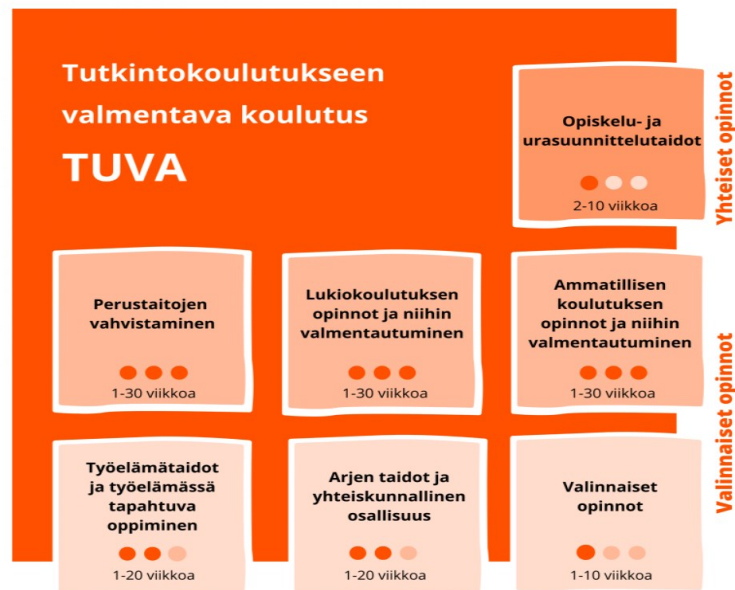
Kaavio 2. TUVA-koulutuksen osat. (Opetushallitus, 2023)

osassa opiskellaan perustaitojen vahvistamista (1–30 viikkoa), lukiokoulutuksen opintoja ja niihin valmentautuminen (1-30 viikkoa), työelämätaitoja ja työelämässä tapahtuvaa oppimista (1-20 viikkoa) tai arjen taitoja ja yhteiskunnallista osallisuutta (1-20 viikkoa) ja valinnaiset opinnot (1-10 viikkoa). (Opetushallitus i.a.). Oheinen kaavio kuvaa tutkintokoulutuksen valmentavan koulutuksen osia.