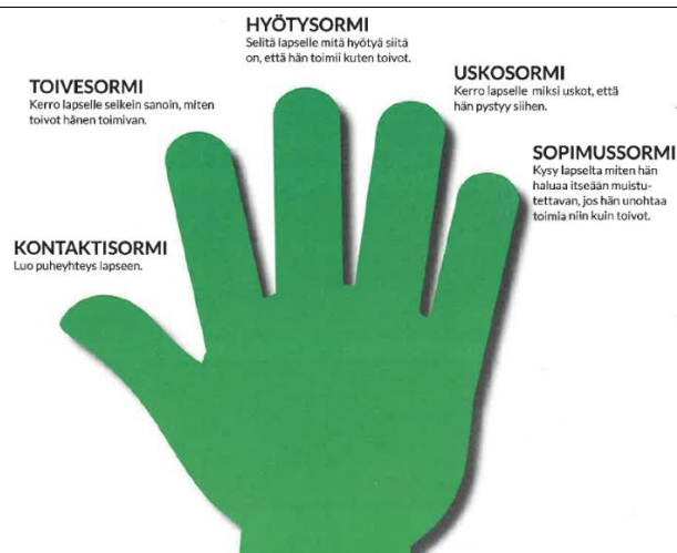
KUVA 1. Viiden sormen muistisääntö (Furman 2017, 42–43)

Käytävällä on onnenpyörä (liite 12), jossa on numeroita. Perheet saavat pyörittää onnenpyörää ja tehdä numeroiden osoittamia tehtäviä, jotka tukevat perheen yhteistyötä sekä kommunikaatiota. Kaikki ohjaajat ovat vastuussa siitä, että perheet saavat tarvittavan ohjeistuksen ja tuen tehtävien tekemiseen.