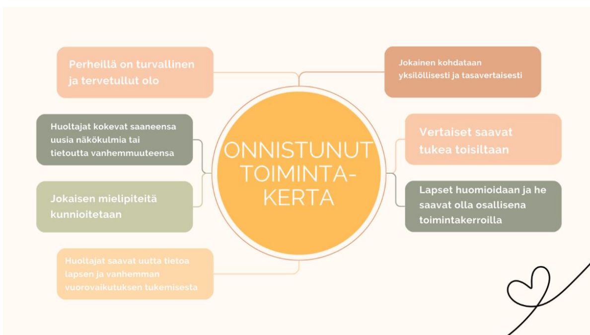
KUVA 4. Onnistunut toimintakerta

Arviointia tehtiin toimintakertojen kävijäluvun, siellä saadun suullisen palautteen, ohjaajien havaintojen sekä kyselyiden perusteella. Lisäksi jokaisen toimintakerran jälkeen täytettiin arviointilomake, jonka avulla arviointia tehtiin toimintakertojen ja kehittämistyön onnistumista. Onnistunut toimintakerta (Kuva 4.) määriteltiin tässä kehittämistyössä sellaiseksi, jossa perheillä on toimintakertojen aikana ollut turvallinen ja tervetullut olo. Lisäksi he ovat kokeneet saaneensa jotain uutta tai merkityksellistä näkökulmaa tai tietoutta vanhemmuudesta sekä lapsen ja huoltajan välisestä vuorovaikutuksesta. Onnistuneella toimintakerralla on lisäksi tärkeää, että lapset sekä huoltajat on kohdattu yksilöllisesti, tasavertaisina ja heidän mielipiteitään on kunnioitettu sekä se, että huoltajat ovat kokeneet saaneensa tukea vanhemmuuteensa.