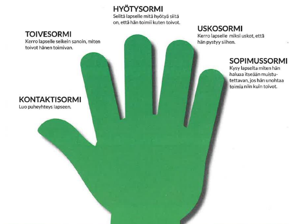
KUVA 1. Viiden sormen muistisääntö (Furman 2017, 42)

Perheiden arjessa tulee väistämättä eteen tilanteita, joissa lapsi ei kehuista ja kiittelyistä huolimatta aina toimi aikuisen toiveiden mukaisesti. Kaikkia aikuisia tällaiset tilanteet turhauttavat ja paremman keinon puuttuessa he voivat turvautua vanhoihin tuttuihin menetelmiin, kuten lahjominen, uhkailu sekä äänen korottaminen. Viiden sormen muistisääntö (Kuva 1.) auttaa aikuisia muotoilemaan sanat niin, että lapsi ymmärtää aikuisen sanoman ilman, että aikuisen tarvitsee turvautua vanhoihin menetelmiin. Viiden sormen muistisäännöllä voidaan siis puuttua johonkin sellaiseen lapsen käyttäytymiseen, johon toivotaan muutosta. (Furman 2017, 10, 40, 42, 61.)