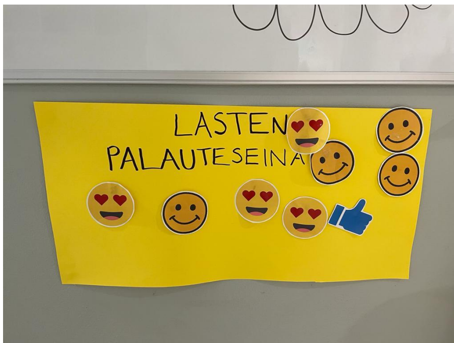
KUVA 3. Lasten palauteseinä. (Kolu 2023 a, CC BY)

lasten ja huoltajien osallisuutta sekä mahdollisuutta vaikuttaa toimintaan. Lasten ja huoltajien osallisuus on keskeinen periaate varhaiskasvatuksessa (Karjalainen ym. 2020, 39; OPH 2022, 15).