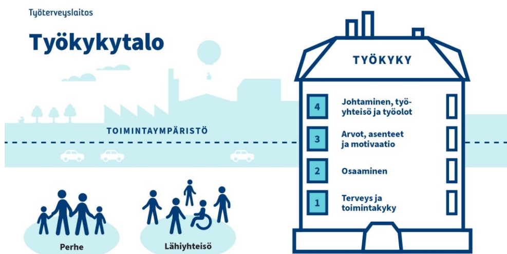
KUVIO 1. ©Työterveyslaitos Työkykytalo (Työterveyslaitos n.d.b.)

Työterveyslaitoksen työkykytalo-mallissa taas työkykyä kuvataan talon muodossa. Tässä on neljä kerrosta. Kolmessa alimmassa kerroksessa on yksilön omia voimavaroja. Ylimmässä eli neljännessä kerroksessa kuvataan työtä, johtamista ja työskentelyolosuhteita. Kun kaikkia kerroksia kehitetään koko työelämän ajan, se mahdollistaa työkykytalon pysymisen pystyssä. (Työterveyslaitos n.d.b.)